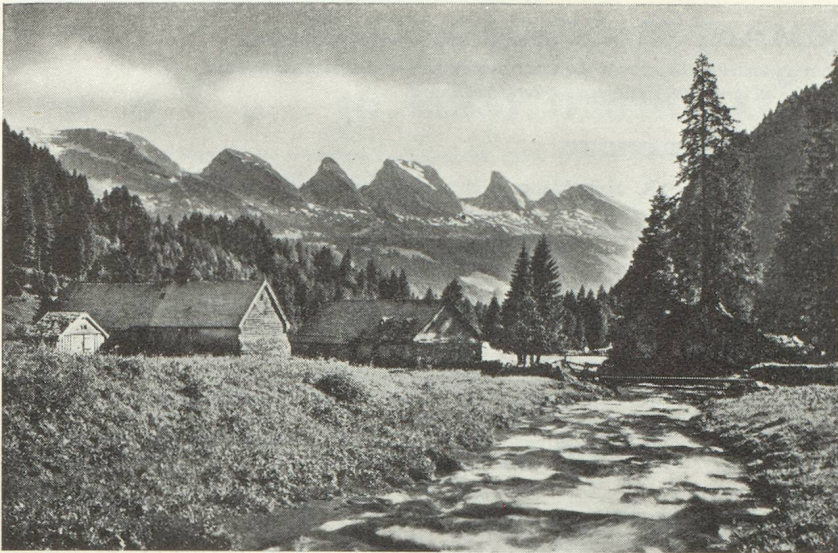
Les alpes du Toggenbourg