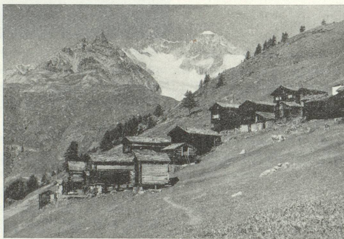
Findelen sur Zermatt, dans le canton du Valais

Nombreux funiculaires, téléphériques et télésièges.