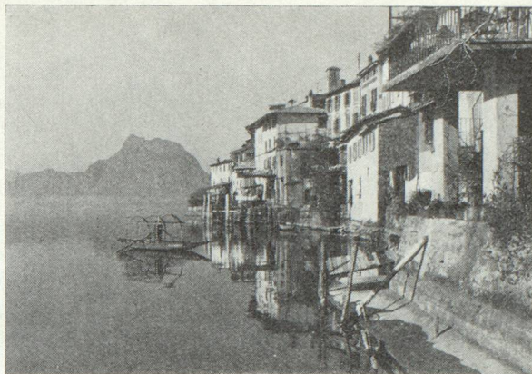
Gandria au bord du lac de Lugano

Par le rail ou la route : Interlaken, train ou 56 km. (via Thoune), Berne (changer), train ou 32 km., Bienne (changer), train ou 32 km., Moutier, train ou 12 km.,