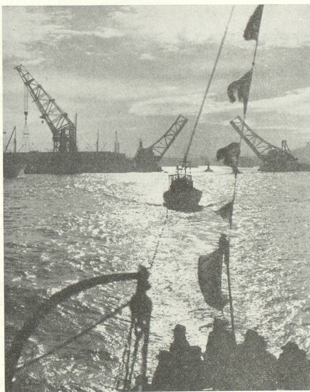
Port de Marseille : contre-jour sur la mer

Il est certain que la conjonction des efforts, joints à l'activité déployée par tous les organismes publics ou privés qui sont constitués en vue de développer le trafic franco-suisse, permettront à Marseille de retrouver la place qu'elle occupait avant la guerre, et qui est la première dans le trafic de transit franco-suisse.