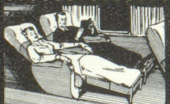
★ dans d'excellents fauteuils-couchettes.