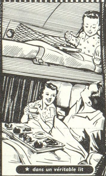
★ dans un véritable lit

3, BOULEVARD MALESHERBES - PARIS - TÉL. ANJOU 08-00