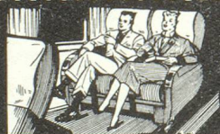
★ dans les fauteuils inclinables Air France.