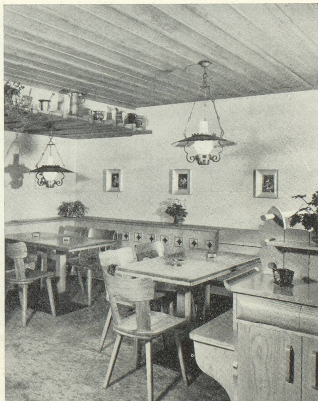
Aménagement d'un « Carnotzet »

Ce tour d'horizon sur les industries suisses de transformation du bois — très limité par la place impartie — n'avait d'autre raison que de démontrer la vitalité d'un secteur de la production suisse dont les capacités sont actuellement très élevées. Si ses débouchés restent essentiellement le marché interne il a, toutefois, et à plusieurs reprises, démontré qu'il était à même de s'organiser très rapidement pour faire face à d'autres demandes par l'entremise des fédérations professionnelles. Celles-ci groupent en effet la plupart des entreprises importantes du pays et peuvent diriger sans difficulté l'exécution d'importants travaux en bois.