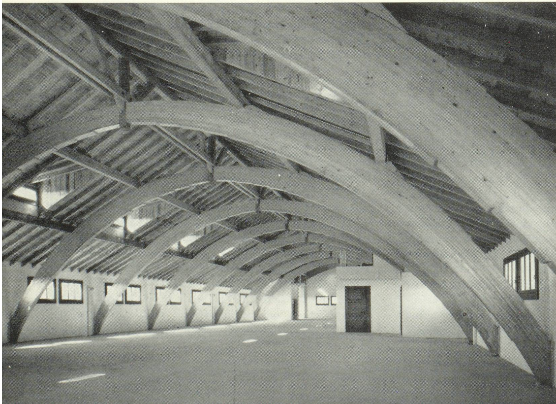
Charpente collée : Magasins Généraux du Comptoir Suisse à Lausanne

La connaissance du matériau bois et de ses possibilités d'utilisation a fait des progrès considérables au cours des dernières années grâce aux recherches des laboratoires spécialisés et a été répandue au maximum. De même, les produits nouveaux, derniers-nés de la technique moderne et s'alliant harmonieusement au bois dans la décoration des intérieurs, ont été assimilés par les transformateurs du bois et entrent maintenant pour une large part dans leur fabrication.