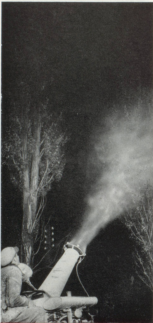
Lutte contre le hanneton : un atomiseur pendant le travail nocturne.

s'aperçut cependant que la mouche domestique était devenue résistante contre les produits « D. D. T. » : aux États-Unis 13 % seulement des mouches étaient encore sensibles en 1949. Pour la Suisse le pourcentage établi en 1950 était tout aussi significatif : sur 61 % de mouches normalement sensibles venaient 27 % accusant une résistance naissante, et 12 % étaient déjà résis-