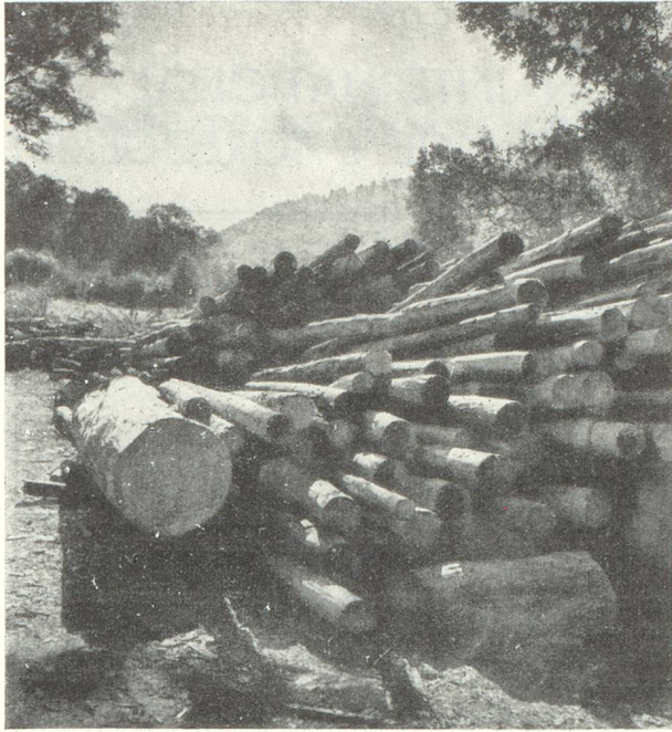
Coupe de sapins.