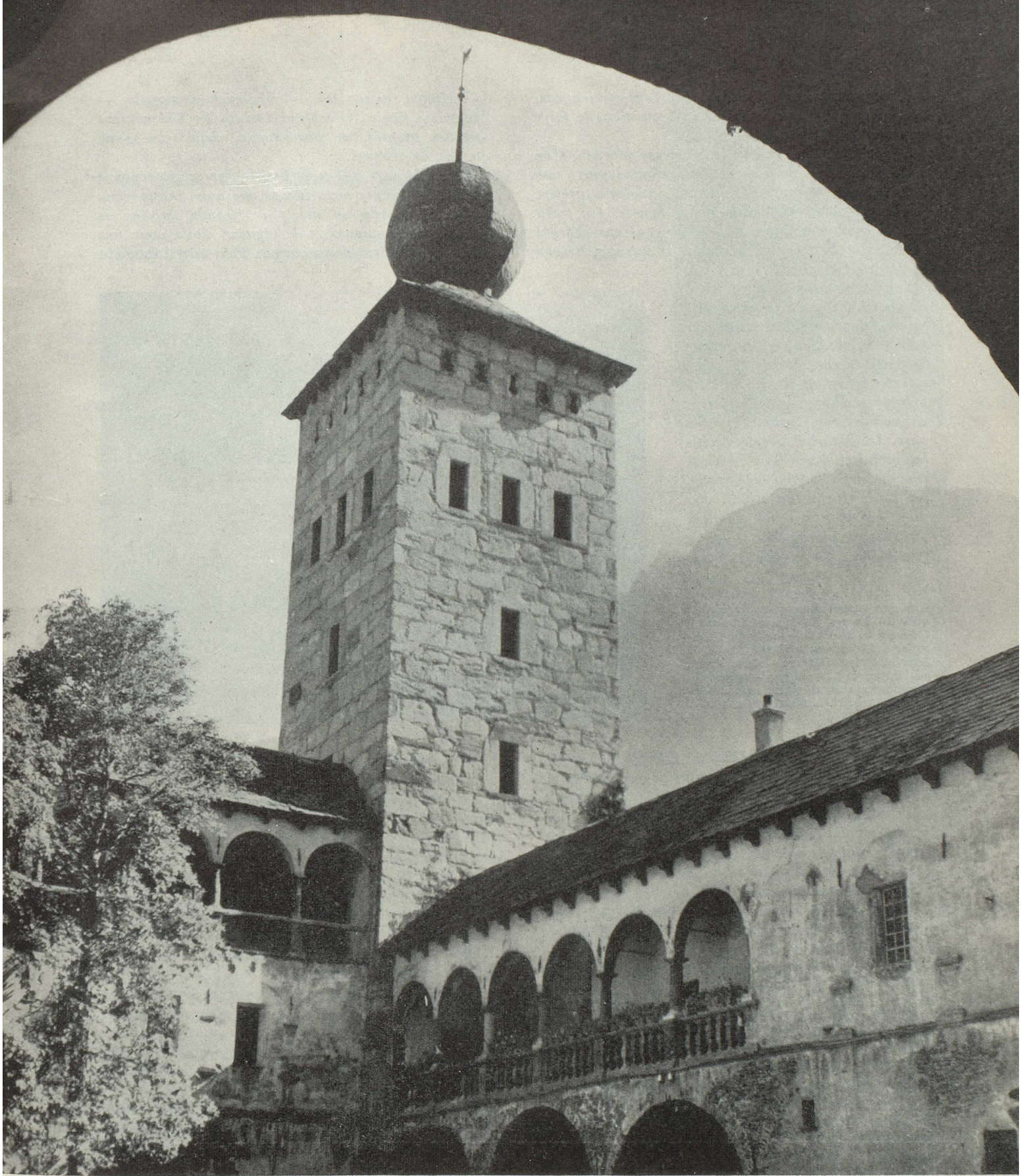
Le Palais Stockalper à Brigue.