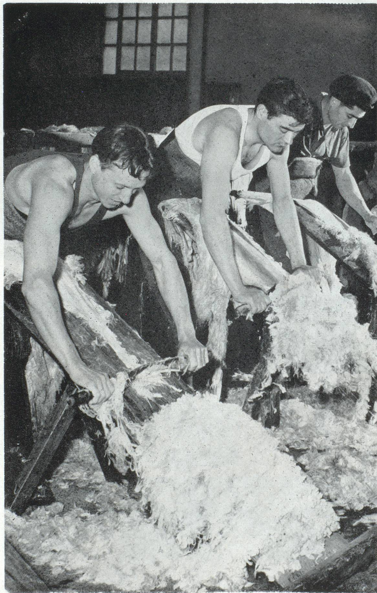
L'opération du pelage des peaux

au délainage, bénéficiant de conditions climatiques permettant de conduire dans d'excellentes conditions le développement des bactéries nécessaires à la fermentation naturelle qui est la base du procédé, Mazamet a su, par l'esprit d'audace et d'entreprise, par le sens financier et commercial avisé de ses importateurs, usiniers, négociants, agents-vendeurs, courtiers, tout aussi bien que par l'habileté et l'expérience de ses ouvriers, créer un centre à la fois industriel et commercial, qui est devenu en quelque sorte un marché de « disponible » en laines et cuirs, toujours prêt à satisfaire les clientèles françaises ou étrangères les plus exigeantes.