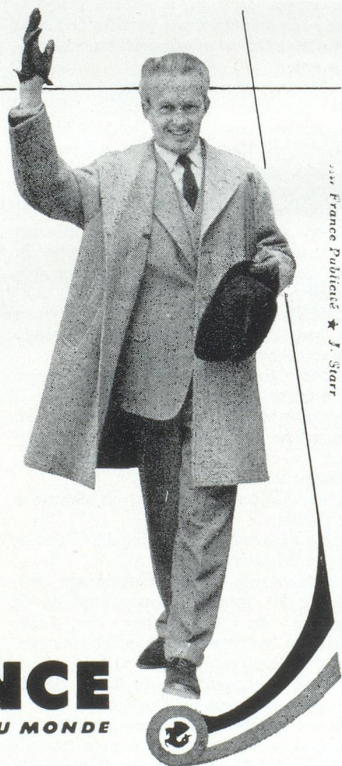
— Air France Publicité — J. Starr

AIR FRANCE LE PLUS GRAND RÉSEAU DU MONDE