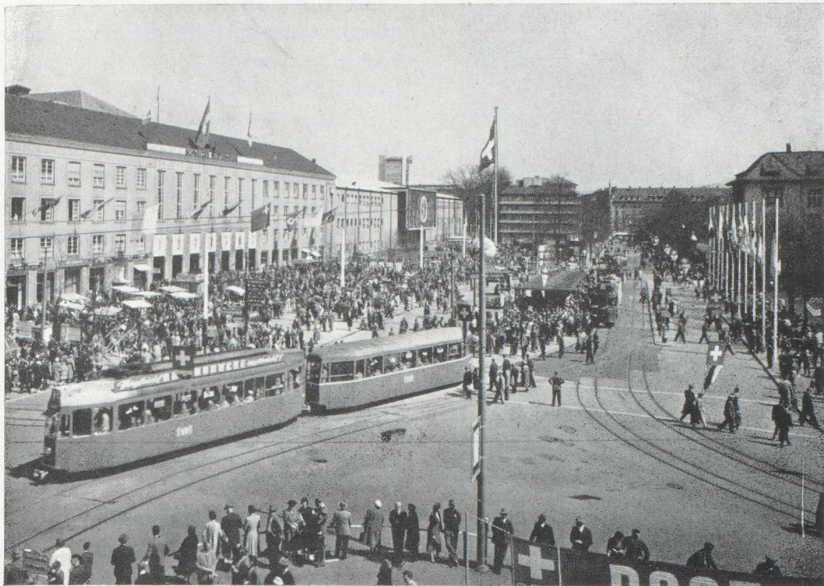
L'animation sur la place devant les deux bâtiments principaux de la Foire Suisse d'Échantillons de Bâle. 43 e Foire : du 11 au 21 avril 1959.