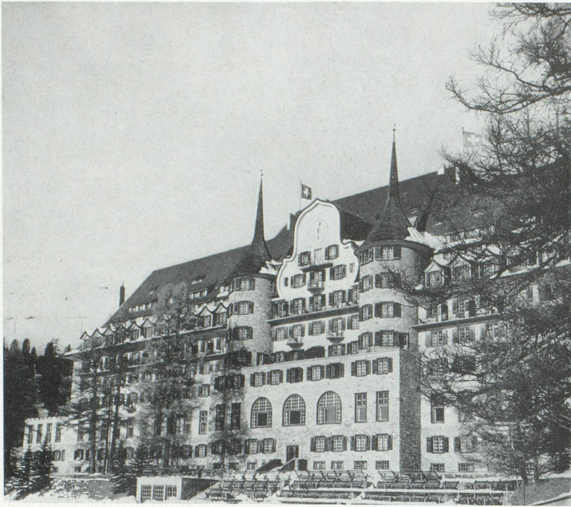
Un grand hôtel de Saint-Moritz : « Suvretta »

travaux de modernisation. La très brève durée de la haute saison proprement dite est la cause première de cette situation, car le taux d'occupation des lits est beaucoup trop faible pendant l'avant et l'arrière saison. L'expérience prouve que seuls les hôtels équipés de manière assez confortable pour que l'hôte accepte une brève période de mauvais temps peuvent allonger leurs saisons. Les hôtels doivent donc être dotés de ce confort, qui est la condition même de leur rentabilité future. Ce que l'on demande aujourd'hui, c'est un confort raffiné dans les locaux généraux, et, dans les chambres, une atmosphère qui incite à y séjourner. De nombreux hôtels ont été rénovés avec succès dans ce sens, mais il reste encore beaucoup à faire.