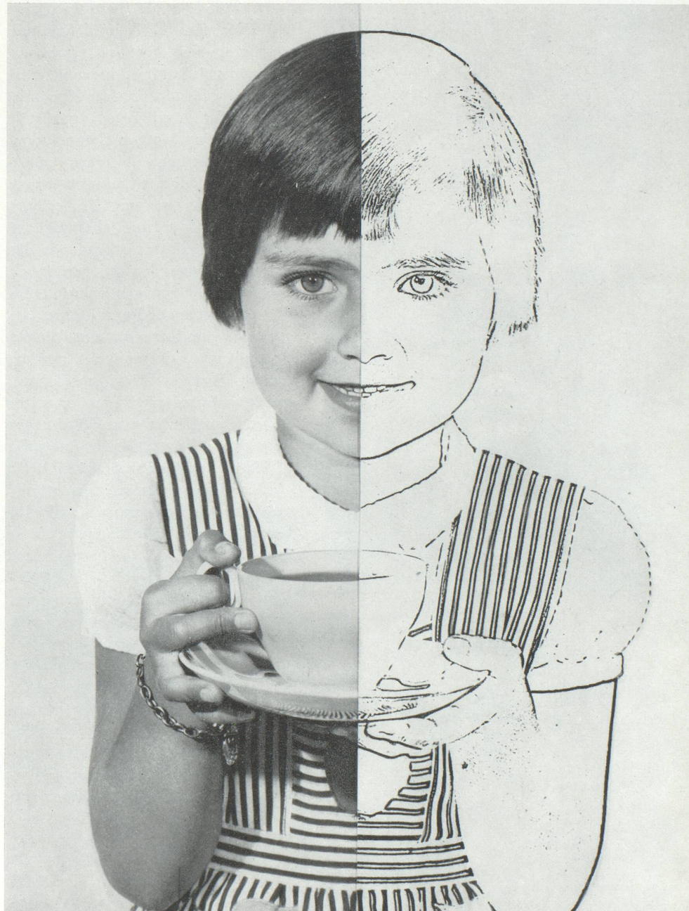
Partie de gauche : photo originale Partie de droite : photo au trait