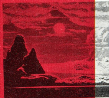
RIEN POUR LES VIVRES, Cuba, Kibao, montagne sacrée, dans l'ouest de la Sierra Maestra. Les montagnes de la Sierra Maestra sont les plus riches en biodiversité de l'Amérique du Sud. Elles sont traversées par les routes principales de l'Amérique du Sud.