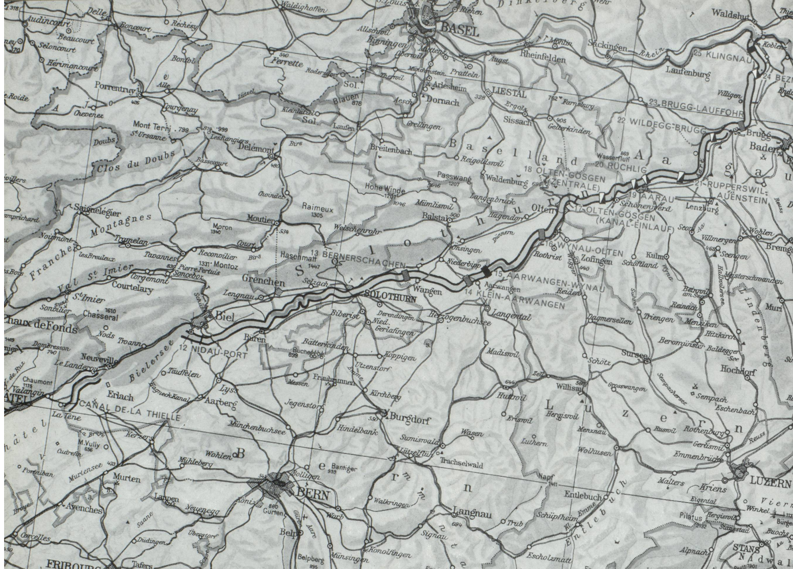
Pour le secteur Rhin-Aar-lacs jurassiens, toutes les questions sont réglées. D'ici quinze ans les automoteurs partis de Rotterdam devraient arriver à Neuchâtel et Yverdon.