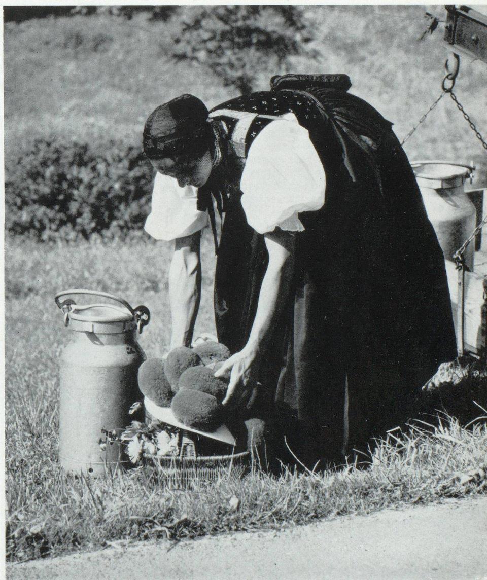
L'agriculture allemande est prise de peur devant le Marché Commun.

A l'appui de ces arguments on peut citer l'importante prise de position de l'Association des Chambres d'Indus-