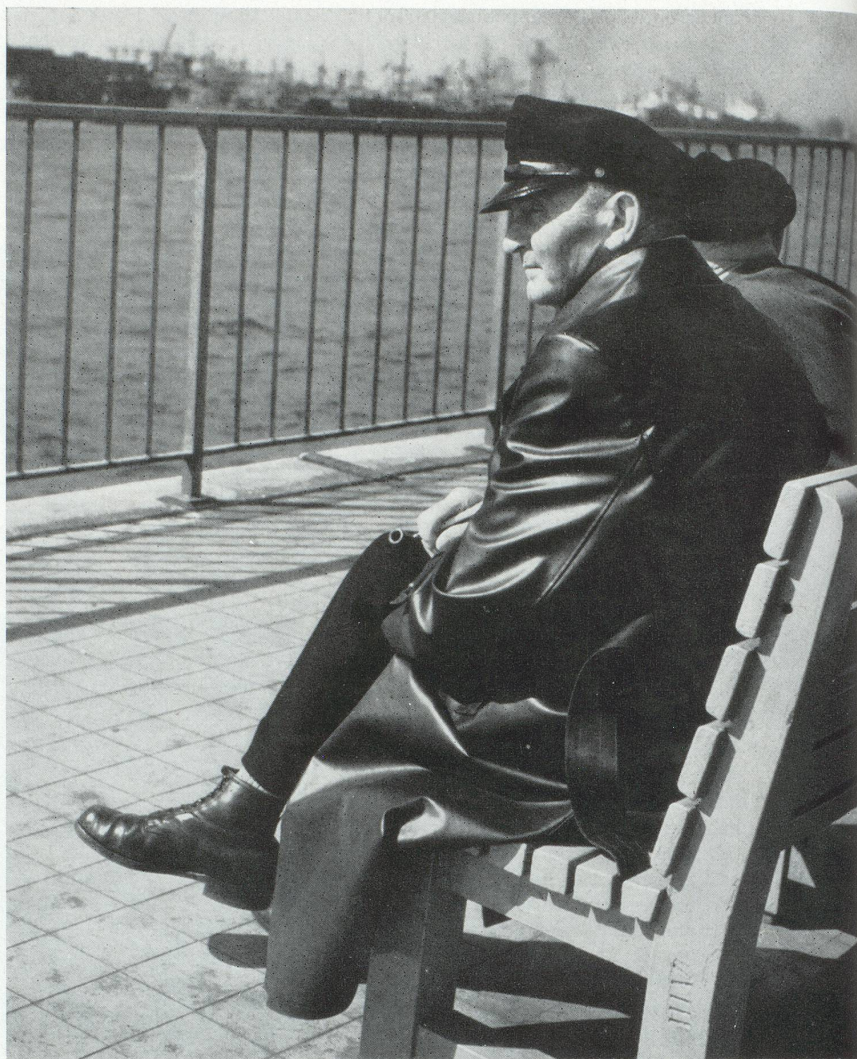
« Les vastes océans du libre-échange ».

» Quant aux chemins à emprunter pour arriver à ce but, les opinions sont malheureusement toujours très partagées parmi les États membres. L'Association des Chambres d'Industrie et de Commerce d'Allemagne regrette l'absence dans le programme d'action, d'une analyse des différentes conceptions existant au sein de la Communauté, conceptions relatives à une intégration plus large