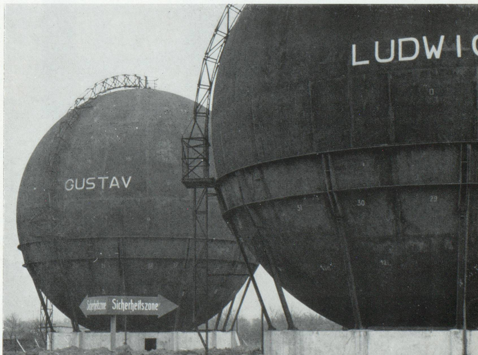
Zone de sécurité.