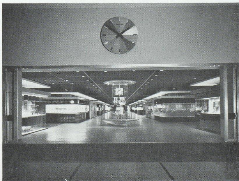
Entrée principale de la Foire de l'Horlogerie.

étonné aucune des personnes s'intéressant à l'activité économique suisse, tant les deux manifestations étaient différentes l'une de l'autre. L'Exposition de Lausanne, qui devait voir un grand nombre de visiteurs français franchir ses portes, s'attachait surtout à présenter les valeurs et les buts spirituels de la Suisse dans le cadre d'un beau livre d'images; alors qu'à Bâle, la Foire Suisse d'Échantillons poursuivait, comme d'ailleurs depuis près de 50 ans, son but éminemment commercial. Son leitmotiv est d'ailleurs, et restera inchangé : être le lieu de rencontre de l'offre et de la demande, un lieu où se concluent de bonnes et d'excellentes affaires en mettant en présence une fois par année producteurs et acheteurs. Grâce aux compagnies d'aviation AIR-INTER et SWISSAIR qui relient par la voie des airs la cité rhénane à la plupart des grandes villes françaises, vous pourrez vous rendre à la Foire de Bâle confortablement et dans un minimum de temps. De plus, d'excellentes liaisons ferroviaires existent aussi entre Bâle et la majorité des centres industriels et commerciaux par des trains rapides ou des routes directes.