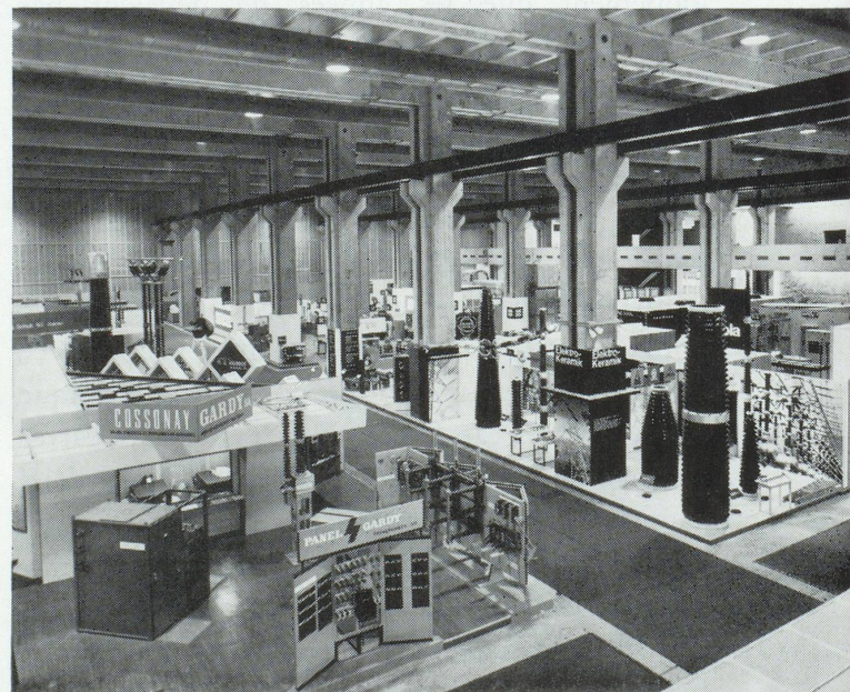
Dans le vaste rez-de-chaussée du nouveau bâtiment du Rosental, de volumineux objets d'exposition — sur cette illustration ceux de l'électrotechnique industrielle — sont mis pleinement en valeur.

Il peut paraître paradoxal que la Suisse, petit pays enclavé, situé sur la marge méridionale de l'Europe centrale et dans le bassin des fleuves européens les plus importants, soit fortement engagée dans l'économie mondiale. C'est pourtant cette situation peu ordinaire qui a donné naissance à un État hautement industrialisé. Le sol de l'Helvétie ne pouvant faire vivre sa population, une partie toujours plus grande de celle-ci est engagée dans l'industrie, les manufactures, le commerce, les services de transport et l'hôtellerie. Si l'on considère le revenu et la fortune de sa population, la Suisse se classe parmi les nations les plus favorisées. Sa prospérité est soigneusement entretenue par un instrument parfaitement au point et entièrement consacré à l'expansion économique du pays : la Foire Suisse d'Échantillons. Cette institution est une manifestation spécifique de