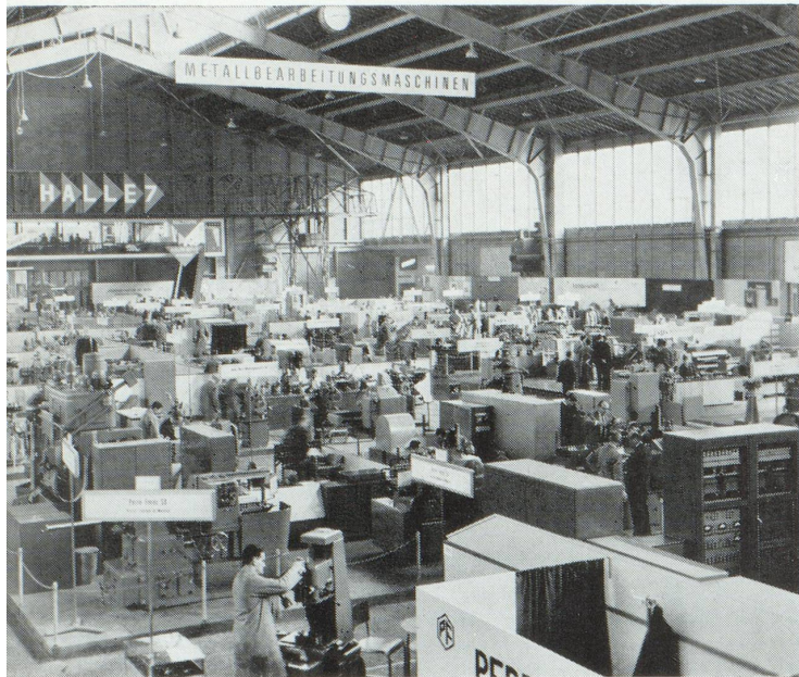
Deux grandes halles couvrant ensemble 10 000 m 2 de surface sont à la disposition des machines-outils à la Foire de Bâle. (Photo Zimmermann).

et de toutes les professions à se rendre en grand nombre à la Foire de Bâle. Les visiteurs français se classent d'ailleurs au second rang du nombre des visiteurs étrangers enregistrés par le Service d'accueil de la Foire. Chaque année en effet, plus de 100 000 visiteurs étrangers (venus de 112 pays en 1964) saisissent l'occasion qui leur est offerte de trouver à Bâle un condensé très attrayant de tout ce qui est fabriqué en Suisse et, partant, de conclure de bonnes affaires. Plus que jamais, la Foire de Bâle reste le lieu de rencontre de l'offre et de la demande. Une visite de la manifestation se révèle toujours profitable et offre un intérêt immédiat pour deux groupes de visiteurs. La Foire Suisse d'Échantillons accueille tout ce qui a un nom dans la vie industrielle suisse; pour beaucoup d'entreprises, le chiffre d'affaires annuel dépend en grande partie du volume des ordres passés à la Foire. De plus, les fournisseurs de matières premières ont tout loisir de s'enquérir auprès des fabricants suisses de leur besoin.