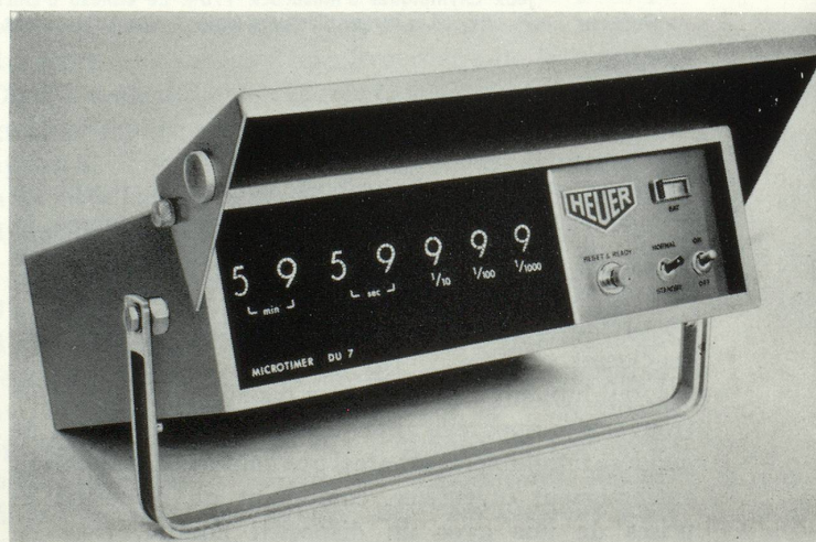
Un nouveau compteur de temps électronique, le « Microtimer » de Heuer-Léonidas S.A., mesure les millisecondes.

Les manifestations sportives occupent une place importante dans les programmes de télévision. Il est certain que le petit écran a popularisé le sport en drainant des foules considérables que l'éloignement des stades et les obligations familiales privaient d'un spectacle de choix. Conscientes de l'importance de ce phénomène, Omega et Longines ont réalisé des appareils destinés à faciliter le travail des commentateurs sportifs et à décupler l'intérêt des téléspectateurs. C'est ainsi que grâce à « l'Omeoscope » et à la « Télélongines » on peut lire sur l'écran les temps de chaque concurrent du départ à l'arrivée d'une course,