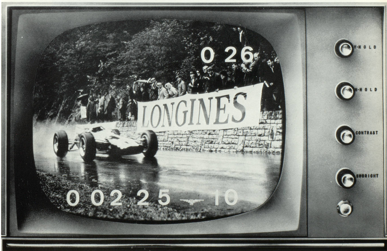
Compteur d'écran TV de Longines. Télolongines - Course de Côte St-Ursanne - Les Rangiers 1965 Jim Clark (photo-montage).