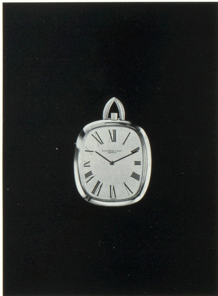
Montre de soirée par excellence, la montre de poche se prête particulièrement bien aux recherches de lignes nouvelles. Cette pièce extra-plate, en or jaune, est d'une pureté de lignes remarquable et démontre clairement l'évolution qui s'est faite de l'ovale à la ligne « tonneau ». Cadran or (Audemars, Piguet).

L'application des règles du Traité de Rome élaborées en vue de la création d'une union douanière entre les « Six » s'est traduite par une double discrimination des