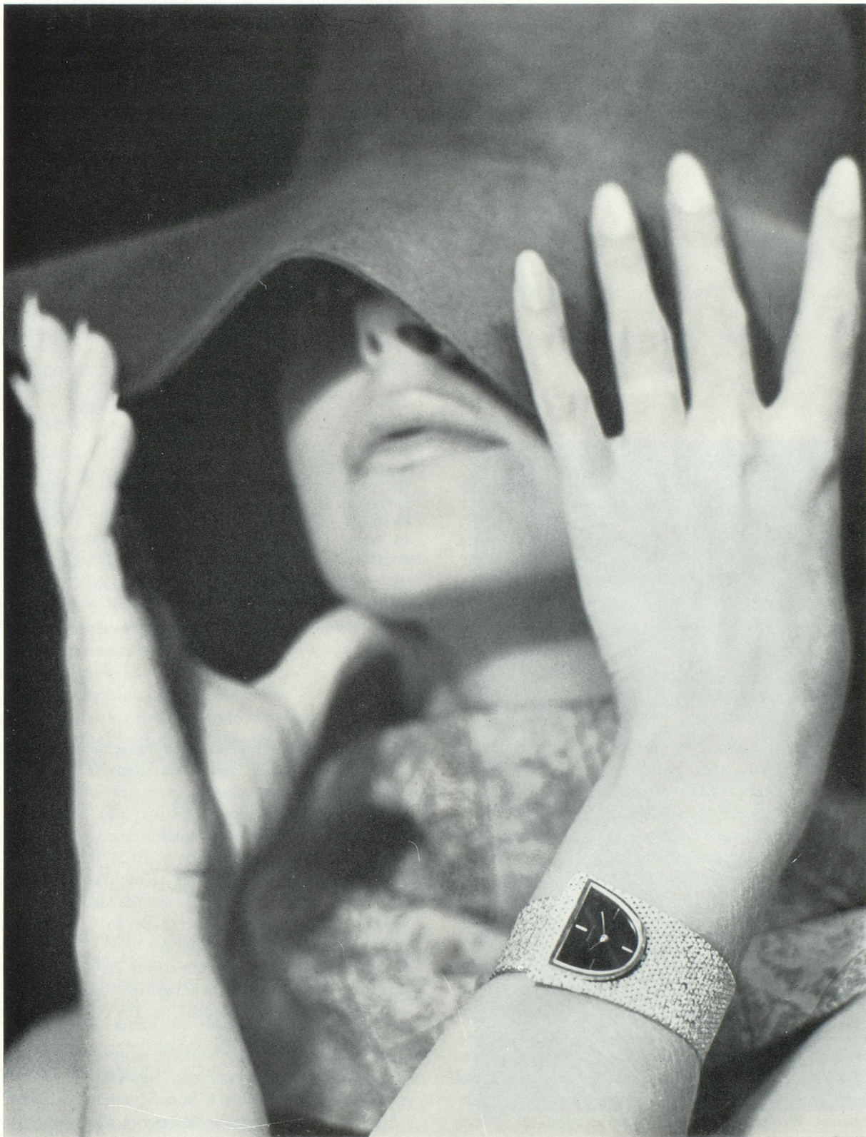
Une montre très originale dans sa forme et dans sa construction. Le boîtier est fixé à l'extrémité la plus mince du bracelet en or tressé. Il vient s'insérer dans une ouverture préparée dans l'autre extrémité de ce bracelet, la plus large. Cadran en demi-ellipse, émail bleu foncé. En or jaune 18 carats (Zenith).