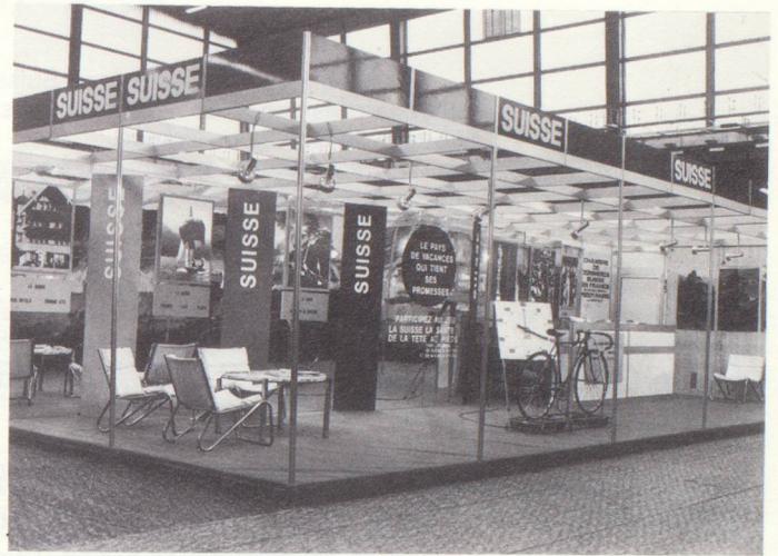
Vue partielle du stand officiel suisse à la Foire Internationale de Paris 1981.