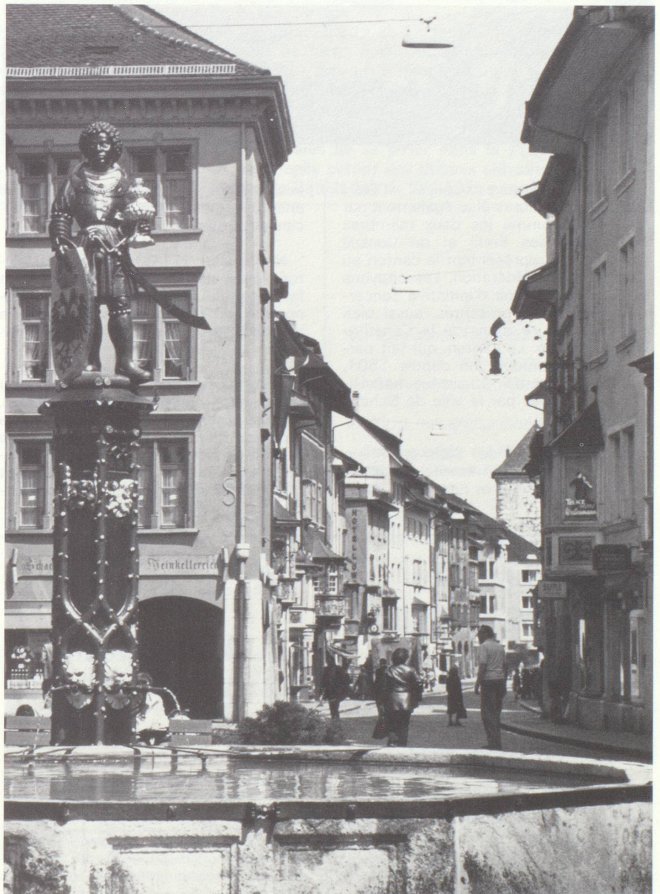
Vieille ville de Schaffhouse avec la fontaine du More.

Le canton est divisé en 6 districts, comprenant 35 communes. La Constitution cantonale date de 1876. L'autorité législative (Grand Conseil) se compose de 80 membres, élus par les citoyens, pour une durée de quatre ans.