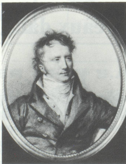
Benjamin Constant, né à Lausanne (1767-1830). (Dessin de Firmin Massot -).

Cette terre de climat équilibré, prospère et de vie facile ne pousse pas aux grands défis historiques et à l'épopée. Les Burgondes qui s'y sont établis se sont fondus avec une élégante discrétion dans la population gallo-romaine, n'ayant ni l'insolence conquérante des Francs, ni la ténacité taciturne des Alamans aux petites communautés coriaces. On voit ainsi les Vaudois, latins de langue et relevant politiquement du Saint-Empire germanique, participer à l'éphémère Lotharingie, qu'encadrent dans le temps deux royaumes de Bourgogne à l'histoire fugace. Les dynastes de Savoie, à cheval sur les Alpes, de Chambéry à Turin, trouvent dans le Pays de Vaud un prolongement naturel de leur État. Ils y dominent trois siècles dans la mesure où les théâtres extérieurs n'accaparent pas leurs forces et