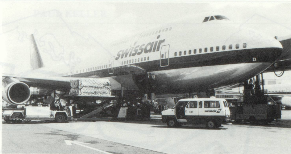
L'assurance transports... « un secteur très diversifié où pratiquement tout ce qui est transportable peut être assuré aujourd'hui »...

Si une évolution structurelle devait se produire, les relations de dépendance internationale y joueraient un rôle non négligeable. L'« International Devision » prend actuellement une importance toujours plus grande. Les trusts et multinationales représentés dans le monde entier obligent les assureurs à rechercher toujours plus souvent des solutions en étroite collaboration internationale. S'ajoute à cela la couverture de risques importants, tels que par exemple les super-pétroliers, les plateformes de forage, les jumbo-jets. Les sommes d'assurances démesurées de certains risques dépassent souvent les possibilités d'un marché.