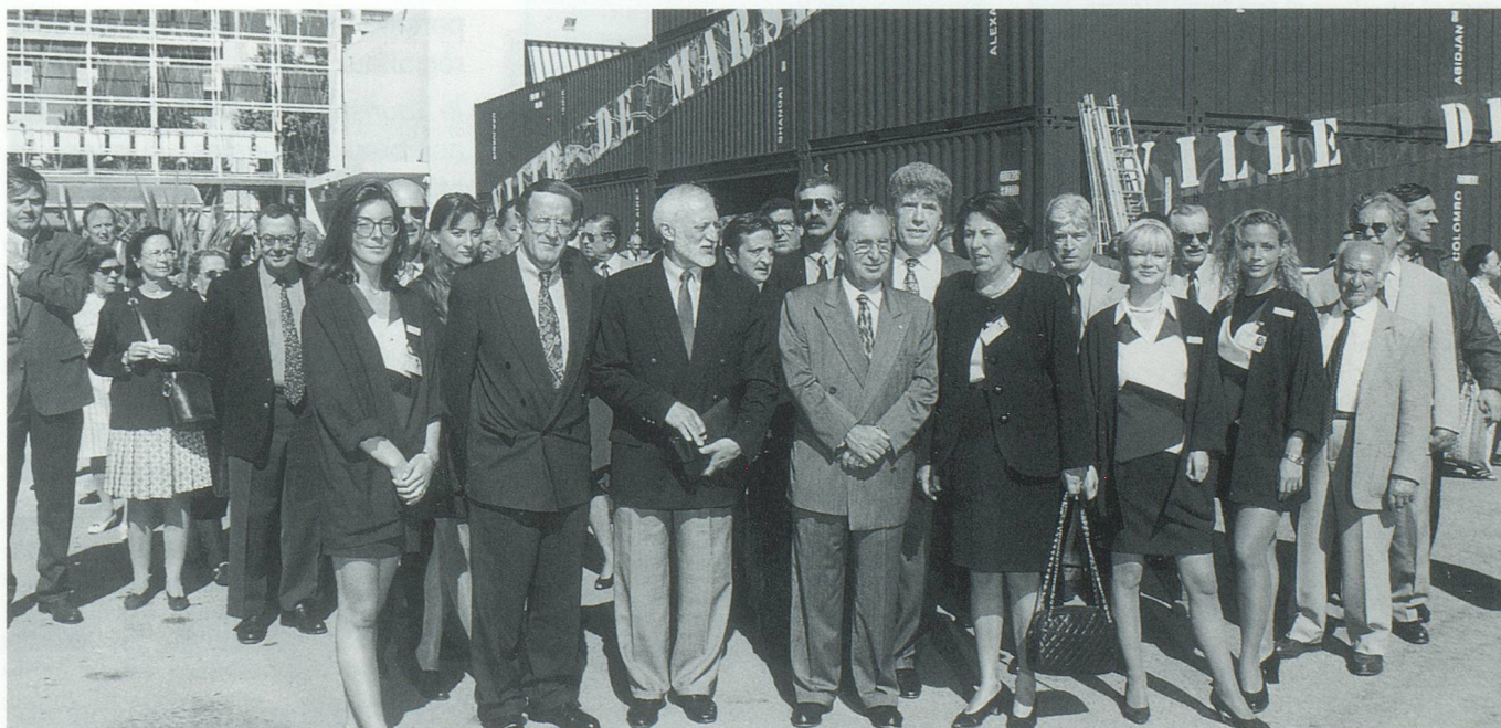
La délégation officielle suisse en visite à la Foire Internationale de Marseille lors de la journée du 27 septembre 1995.