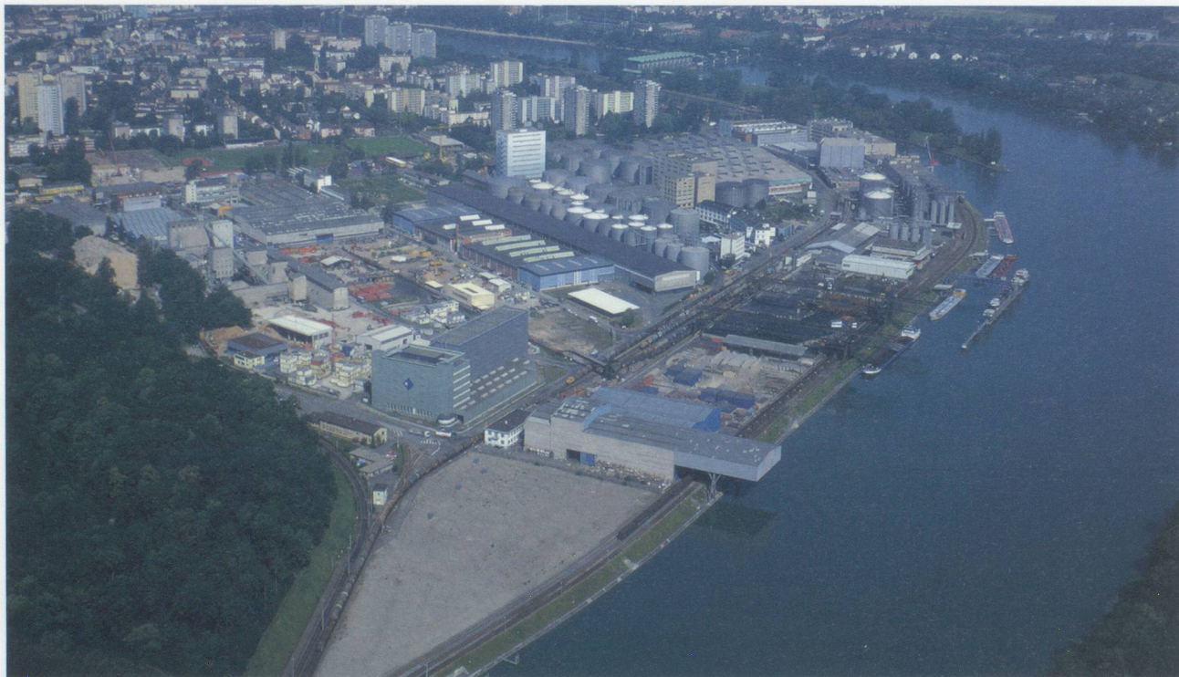
Hafen Birsfelden

permettent le transbordement et le stockage de produits secs classiques tels que l'acier, l'aluminium, les métaux non ferreux, mais aussi les carburants et les combustibles liquides. St Johann situé sur la rive gauche est le plus ancien. Il est notamment spécialisé dans le transbordement et le stockage de céréales et de produits secs en général ainsi que de l'huile alimentaire. Birsfelden