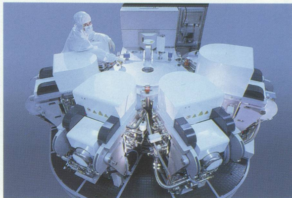
Les semi-conducteurs conçus par l'entreprise Unaxis

spécialisées (universités professionnelles), ses deux écoles polytechniques fédérales, et des