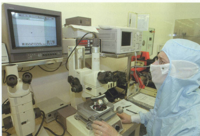
Recherche pharmaceutique dans les laboratoires de Novartis à Bâle

Au-delà des querelles de chiffres, cette évolution largement commentée a donné des arguments de poids aux défenseurs de l'innovation comme François L'Eplattenier, président du Novartis Venture Fund : " L'époque où une grande entreprise pouvait avoir le sentiment de maîtriser l'ensemble du savoir est terminée, expose-t-il. Les start-up sont devenues une