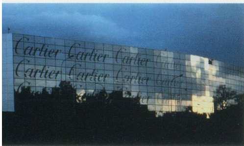
Cartier : le centre international de logistique