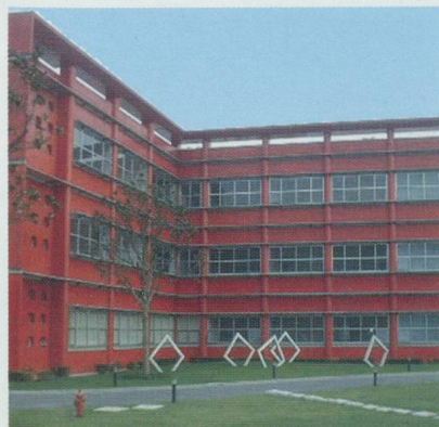
Bâtiment administratif du Swiss Center Shanghai

Le Swiss Center Shanghai (SCS) est une réalisation d'une importance considérable pour la Chambre fribourgeoise du commerce, de l'industrie et des services, mais aussi pour l'ensemble des Chambres de commerce régionales en Suisse. Ce centre est en effet la réponse pratique au besoin exprimé par de nombreuses petites et moyennes entreprises suisses qui souhaitent être guidées de manière professionnelle, peu coûteuse et performante dans leur approche du marché chinois. Ce projet favorise le développement des réseaux internationaux des PME suisses.