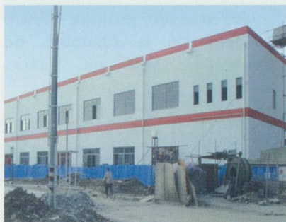
Bâtiment industriel du Swiss Center Shanghai

L'équipe du SCS accompagne les entreprises dans toutes leurs démarches et les assiste dans la mise en œuvre et la gestion globale du projet. De par sa conception, le SCS permet à l'entreprise de choisir elle-même son entrée sur le marché chinois: par une vitrine d'exposition, une