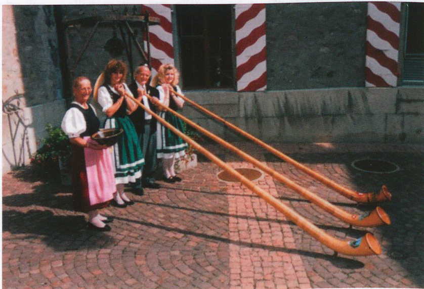
Chacun son rôle et les vaches seront bien gardées

Ces particularismes obligent le management à s'appuyer sur des valeurs radicalement différentes. Les valeurs de sérieux, de persévérance et d'efficacité sont bien sûr présentes. Mais celles d'ordre et de mesure sont surpondérées dans les réponses aux enquêtes. Le sens du « moitié-moitié » est quasiment inné. On trouve également la prudence, et la recherche de sécurité – on ne prend une décision qu'après s'être assuré qu'on peut assumer toutes les conséquences du scénario le moins optimiste. Pas étonnant que ce soit le pays le plus assuré au monde. Et si cette culture de management brille à éviter les excès