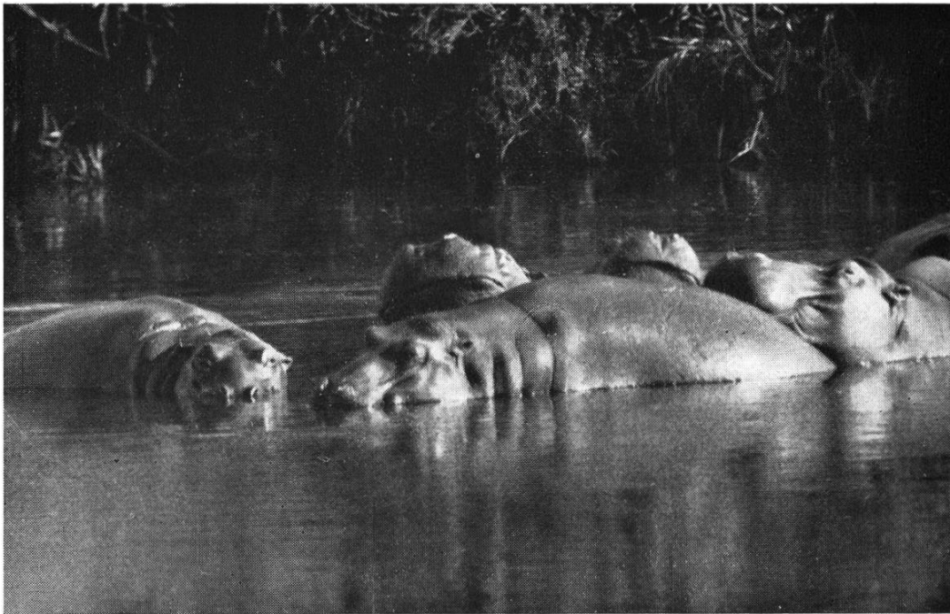
Nilpferde halten sich tagsüber meist im Wasser auf und dösen, in diesem Fall malerisch gruppiert, vom Morgen bis zum Abend. Krüger-Nationalpark (Südafrika)

lung» unberücksichtigt; sie waren aber für uns nicht minder eindrücklich. Die Zeit verging für uns sehr rasch, und dank dem steten Kommen und Gehen der Wildherden vergassen wir den Schlaf. Abwechslung gab es bis in die Morgenstunden, denn kaum hatte sich eine der Elefantengruppen wieder auf den Rückweg gemacht, stand bereits eine andere in der Umgebung bereit. Gab es je einmal eine kleine Zwischenpause, so wurde diese schnell von Büffeln, Gazellen, Zebras und andern Wildarten zum Durststillen benützt. Diese andern Tiere waren jedoch nicht so wählerisch wie die Elefanten und begnügten sich mit dem reichlich verunreinigten Wasser des Pfuhls.