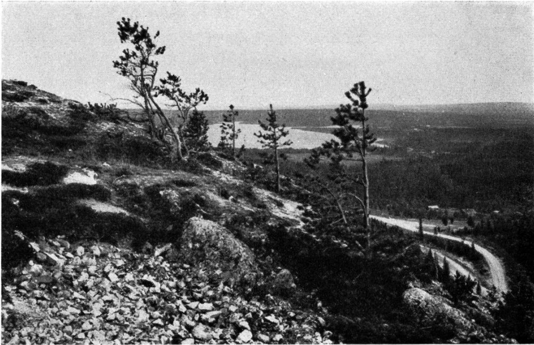
Bei Kuusamo, in der Nähe des Polarkreises

Schlitten, Skiern, in Jeeps und Privatautos sowie zu Pferd und nicht zuletzt zu Fuss den Kirchen zu, die bis auf den letzten Platz gefüllt sind. Wenn die Kirchenglocken durch die Stille der Nacht die Leute zum Besuch des Gottesdienstes aufrufen, ist der Augenblick gekommen, wo in jedem Haus die auf den Fensterbrettern aufgestellten Kerzen angezündet werden. Die Tausende und aber Tausende zuckender Kerzenflämmchen reihen sich zu unzähligen leuchtenden Ketten zusammen, die das soeben erwachte Dorf durchziehen.