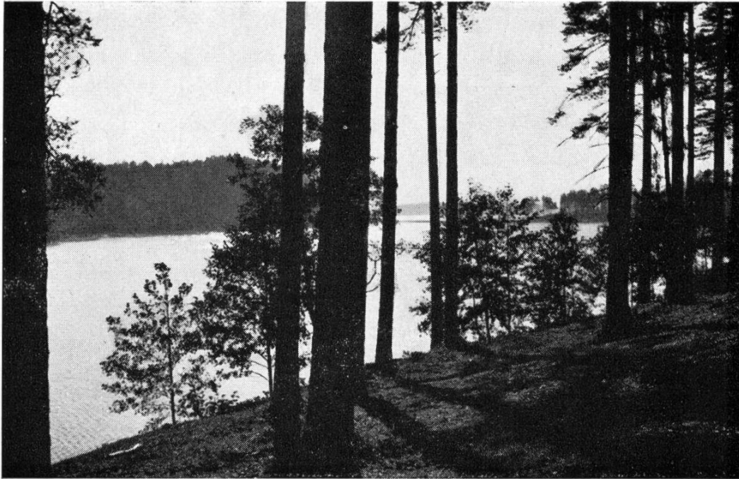
Landschaft in Karelien

nicht so vom Weltgeschehen abgeschieden vorkommt. Die geographische Lage charakterisiert Finnland keineswegs als sogenanntes Durchgangsland. Die geschichtliche Entwicklung seit dem letzten Weltkrieg neutralisierte die Stellung des Landes sowohl auf politischer wie auch auf wirtschaftlicher Ebene. Den Finnen ist es aber bis heute gelungen, den Weg der persönlichen Freiheit seit dem Tag der Unabhängigkeit ihrer Heimat zu begehen, auch wenn er oft mit Dornen gespickt war und heute noch mit Hindernissen versperrt ist.