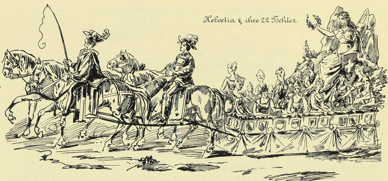
Ausschnitt des Posters: Bilder aus der Geschichte Rheinfeldens. Sonderbeilage der Neujahrsblätter 1992

Geb' Gott dem Volke langen, reichen Segen, Wir bringen ein Willkommen euch entgegen Und Alle sind mit Herz und Hand bereit Zu leisten den verfassungsmäss'gen Eid! — (Die Huldigungsformel wird verlesen und der Eid geleistet.)