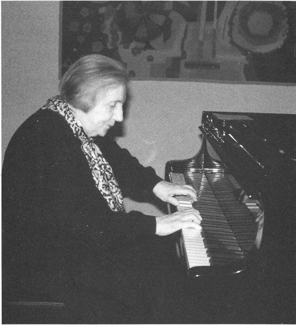
Die Pianistin in ihrem letzten Konzert