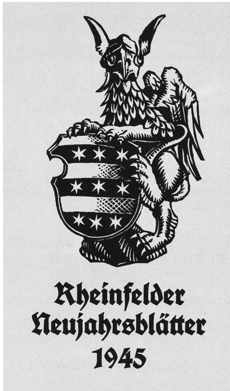
Umschlagbild: Wappen und Wappenhalter vom Leuchter im Gemeindesaal. Zeichnung und Holzschnitt von Ernst Mühlethaler.