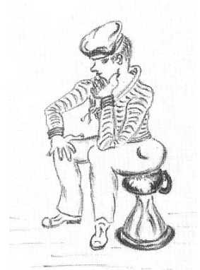
Vignette von G.O. Hausmann zum Gedicht «Rüste, mein Schiff, so rüste!», 1951.

C.P. 3 = offizielle Bezeichnung für: Compagnie de passage, Caserne Prud'homme, Gebäude 3.