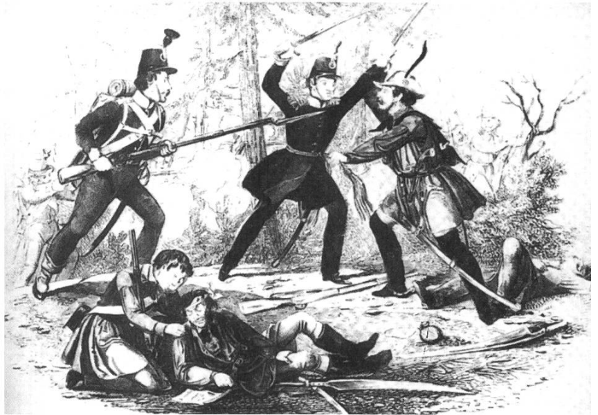
Das Ende der Legion des Dichters Georg Herwegh in Niederdossenbach am 27. April 1848.

Alter: 32 Jahre; Grösse: 5'5"; Statur: schlank; Haare: braun; Augen: braun; Nase: spitz; Mund: mittler; Gesichtsform: länglich; Gesichtsfarbe: gebräunt; Bart: trug bei seiner Entfernung einen braunen Schnurrbart. 10