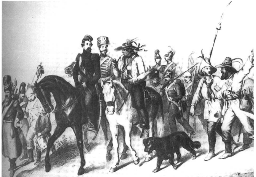
Rückzug der Republikaner im Juli 1849.