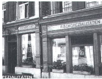
Das «Fischerstübli» an der Marktgasse 11 und 13 findet sogar Aufnahme in den Gastronomie-Reiseführer Gault-Millau im Jahre 1977.