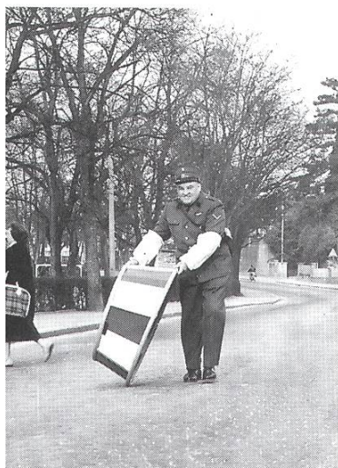
1959: Verkehrsregelung mit der Kanzel bei der heutigen Coop-Kreuzung.

Mit schlitzohrigem lächeln erinnert er sich auch noch an eine Schlägerei im Restaurant National, als er gerade dabei war, einen kleinen wild um sich schlagenden Italiener beim Schopf zu packen und dieser zu ihm sagte: