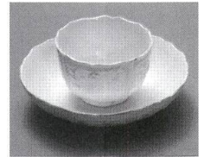
Koppchen und Unterschale, altes Trinkgeschirr zum Genuss von Kaffee.

Die Schokolade generierte wegen ihrer Zubereitung das aufwendigste Porzellan. Da Schokolade sehr heiss und schaumig getrunken wurde, waren neben den speziellen Tassen auch spezielle Kannen nötig. Sie hatten mehrheitlich einen seitlichen Henkel und Füsschen, um sie auf eine Warmhalteflamme stellen zu können, im Deckel befand sich oftmals ein mit einem Schieber verschliessbares Loch für den Quirl.