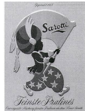
Der «Sarotti-Mohr» der 1886 in Berlin gegründeten Schokoladenfabrik.

Kaffee und Schokolade sind warme Lustgetränke mit einem weit reichenden Einfluss auf kulturelle und gesellschaftliche Sitten und Gebräuche in Europa. Es sind aber auch Volksdrogen (aufgrund ihrer Bestandteile) die mit dem jüngsten Lustgetränk Coca Cola vergleichbar sind.