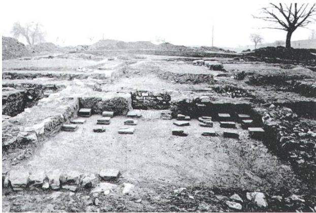
Gesamtansicht der römischen Villa auf dem Betberg

Auf dem Betberg, auch «Bäpperger» genannt, auf der Anhöhe zwischen Wegenstetten und Schupfart, süd-östlich vom heutigen Flugfeld Aero-Club Fricktal, wurden 1931/32 die Fundamente einer römischen Villa freigelegt, vermessen, fotografiert und wieder zugedeckt. Reichhaltig waren die Einzelfunde, Schmuckstücke, Keramikresten und Münzen aus dem 1. und 2. Jahrhundert, die auf den Wohlstand der Bewohner deuten. Die grosszügige Anlage bezeugt, dass neben der Landwirtschaft ein vielfältiges Handwerk und ein blühender Handel bestanden.