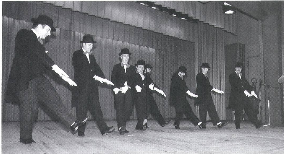
Turnerabend 1983 (75 Jahre DTV).

Auch ein Blick in die Jahresrechnung kann für einmal ganz aufschlussreich sein. Da wurden 1979 Beiträge an Faustball-Aufstiegessen, Fasnachtskostüme, dreitägige Pfingstreise nach München (18 Teilnehmer/innen), Skiweekend Melchsee-Frutt, Kranken- und Geburtstagsgeschenke vermerkt.