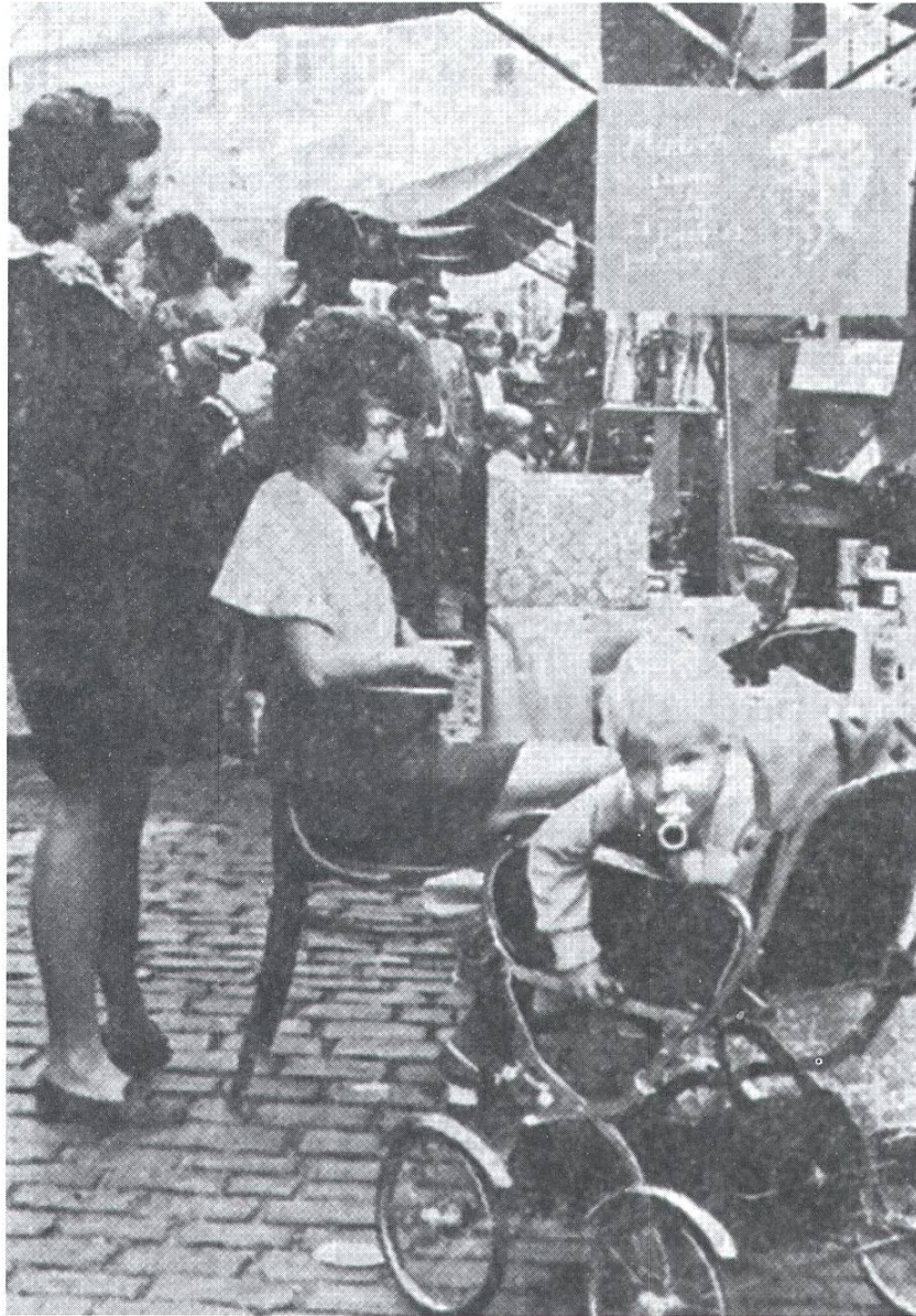
Coiffeuse beim Herbstmarkt Rheinfelden.