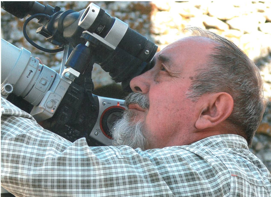
Beim Vogelfilmen in der Extremadura, Spanien.

Oh ja! Das hängt auch davon ab, welche Vögel Sie sehen wollen. Der Magdener Sonnenberg ist ein tolles Revier für Spechte. Da gibt es fast alle Spechtarten, die in der Schweiz vorkommen. Die «Petite Camargue» in der Rheinebene im Norden von Basel ist ebenfalls ein sehr interessantes Gebiet. Dann gibt es noch den Rheinstau bei Kembs oder hier bei Kaiseraugst, oder den Aarestau bei Klingnau. In der Zugzeit sind diese Wasserflächen natürlich besonders interessant. Die beste Zeit zum Vogelbeobachten ist kurz vor Sonnenaufgang. Dazu eine nette, persönliche Geschichte: Mein Schwiegervater war von Beruf General, von der Neigung her jedoch Naturforscher. Als er pensioniert war, hatte er wieder Zeit für die Biologie. Als seine Tochter, meine spätere Frau, 16 Jahre alt war, hat er sie überredet, um 3 Uhr früh aufzustehen, um an einer Vogelstimmen-Exkursion teilzunehmen, die von mir geleitet wurde. Ich war damals 18. Das war 1954, seit der Zeit sind wir unzertrennlich. Es kann also ganz «interessant» sein, Vögel zu beobachten.