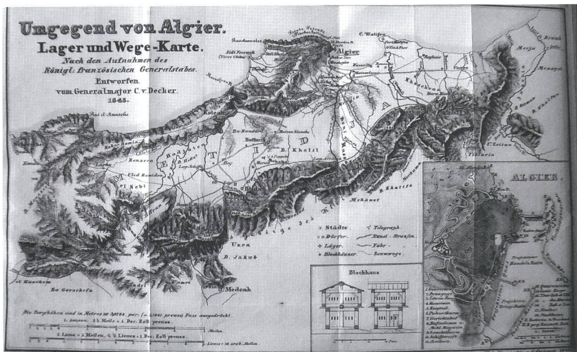
Umgebung von Algier, Karte des frz. Generalstabes (Generalmajor C. von Decker 1843)