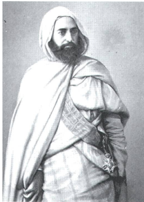
Emir Abd-el-Kader um 1850

vieler Häuptlinge kein Verlass war. Als Hauptwidersacher, entpuppte sich bald der 1832 zum Emir von Mascara gewählte Abd-el-Kader, dem ein grossarabisches Reich vorschwebte. 12 Er war ein Freiheitskämpfer, der den Franzosen immer wieder Gefechte lieferte, bis sie ihn 1847 schliesslich gefangen nehmen konnten. Während all dieser Jahre gelang es Abd-el-Kader, einen Guerrillakrieg zu führen, indem er, z.T. mit grausamsten Methoden, immer wieder einzelne Stammesfürsten auf seine Seite zu ziehen und ihre Loyalität zu erzwingen vermochte.