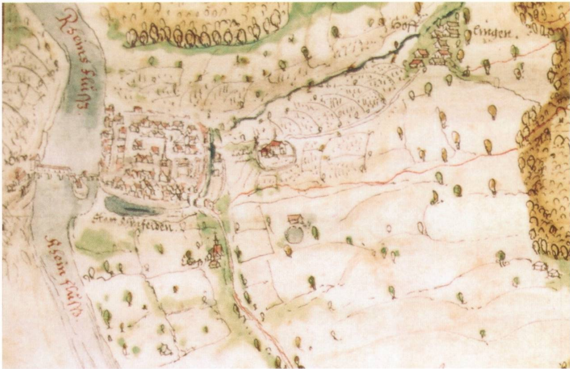
Einzig bekannte Darstellung des Kapuzinerklosters auf der Anhöhe zwischen der Stadt Rheinfelden und dem Dorf Höflingen.

sigjährigen Kriegen (1618–1648) wurde das Kloster des Bettelordens erneuert, diesmal innerhalb der Stadtmauern. Die Kapuzinergasse, die Kapuzinerkirche und das Gebäudegeviert des Klosters sind heute noch erhalten und als städtebauliches Element gut lesbar.