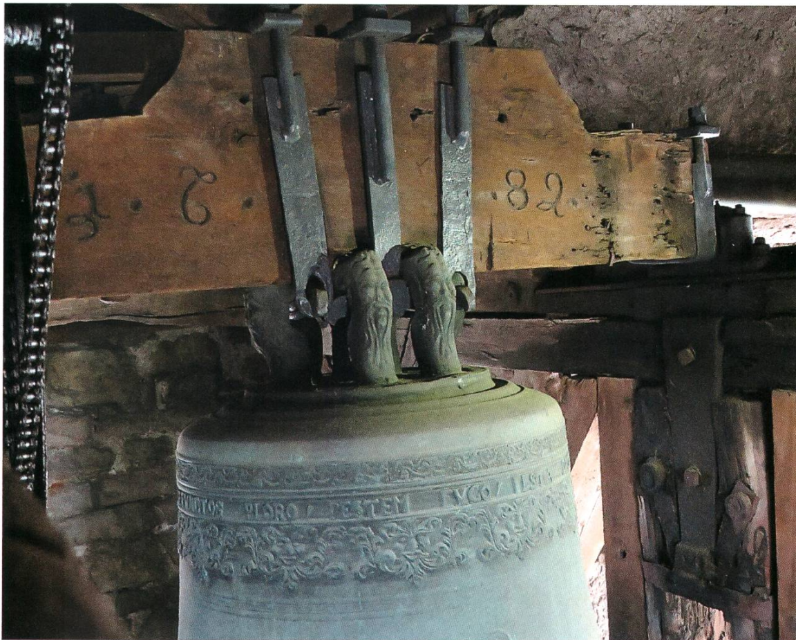
Das Joch der Betzeit-Glocke mit der rätselhaften Gravur

Bis 2002 wurde dieses Geläut jedes Mal manuell pünktlich ein- und wieder ausgeschaltet. Mangels Personalressourcen kam es jedoch zu einem Unterbruch, bis 2004 die Möglichkeit realisiert wurde, dieses Geläut wöchentlich zu programmieren.