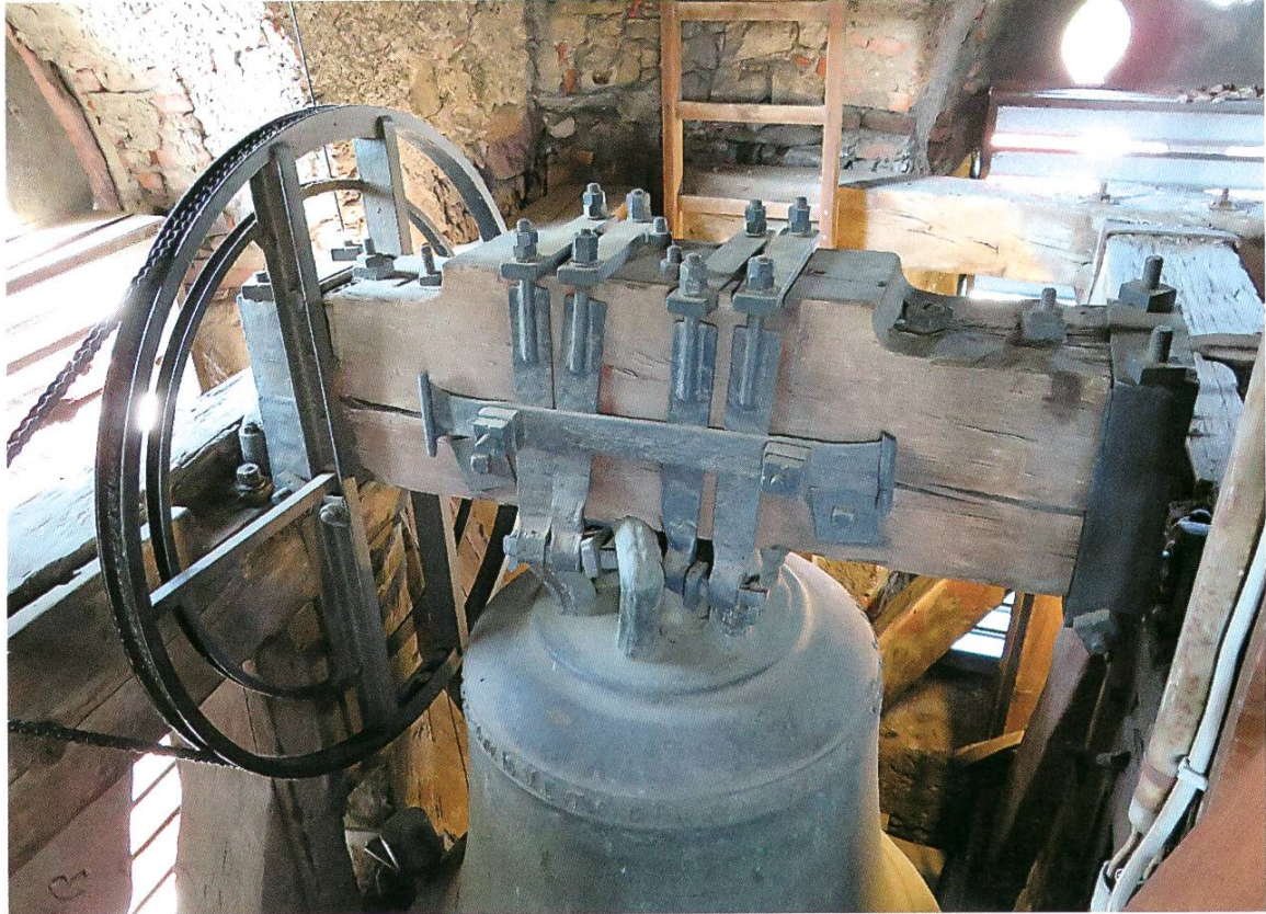
Die Salve-Glocke mit Jochaufhängung und Schwungrad

Die fünf Glocken stammen aus verschiedenen Jahrhunderten und sind klanglich nicht besonders aufeinander abgestimmt. Um dennoch ein harmonisches Klangbild zu erreichen, werden beim vollen Geläut nicht alle fünf, sondern nur die drei grossen Glocken geläutet. Dabei bringen drei Motoren die Glocken eine nach der anderen so in Schwingung, dass ihre Klöppel sie auf der Innenseite des jeweiligen Glockenfusses anschlagen (Fachsprache: Der Klöppel «küst» die Glocke) und zum Erklingen bringen. Das Geläut beginnt jeweils mit der kleinsten Glocke und also mit dem höchsten Ton des Geläuts; die grösste stimmt zuletzt ein. Ebenso scheidet die kleinste als erste aus und die grösste ertönt zum Schluss allein.