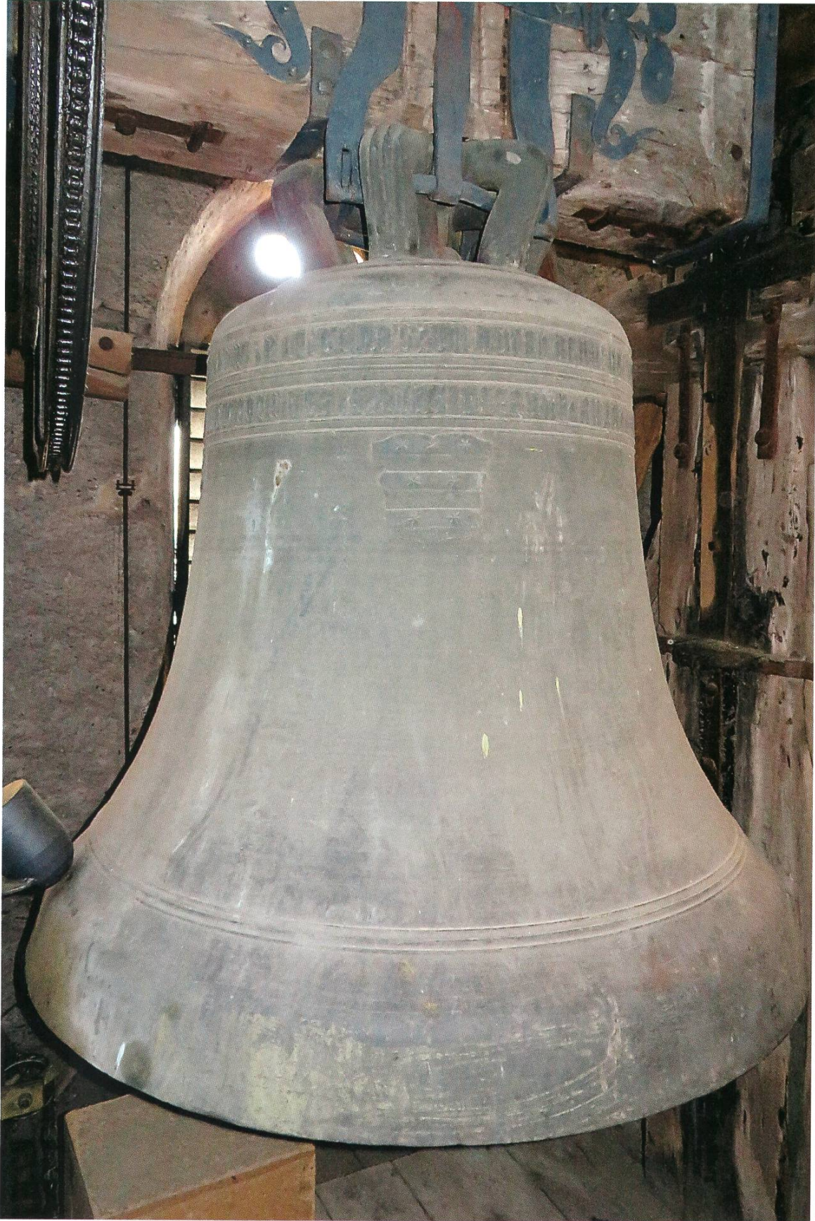
Die Hosianna-Glocke mit Schwungrad und Hammer