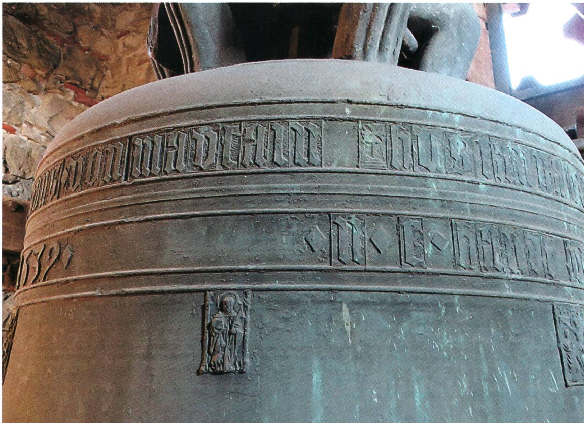
Inschrift der Hosianna-Glocke

Die vierte Glocke, die «Mette-Glocke» (oder «Faschteglöggli», «Güngeli») ist undatiert. Sie stammt aus der ersten Hälfte des 14. Jahrhunderts und ist damit wohl die älteste Glocke des Kantons Aargau überhaupt. Durchmesser 66cm, Gewicht ca. 170 kg, Schlagton e".