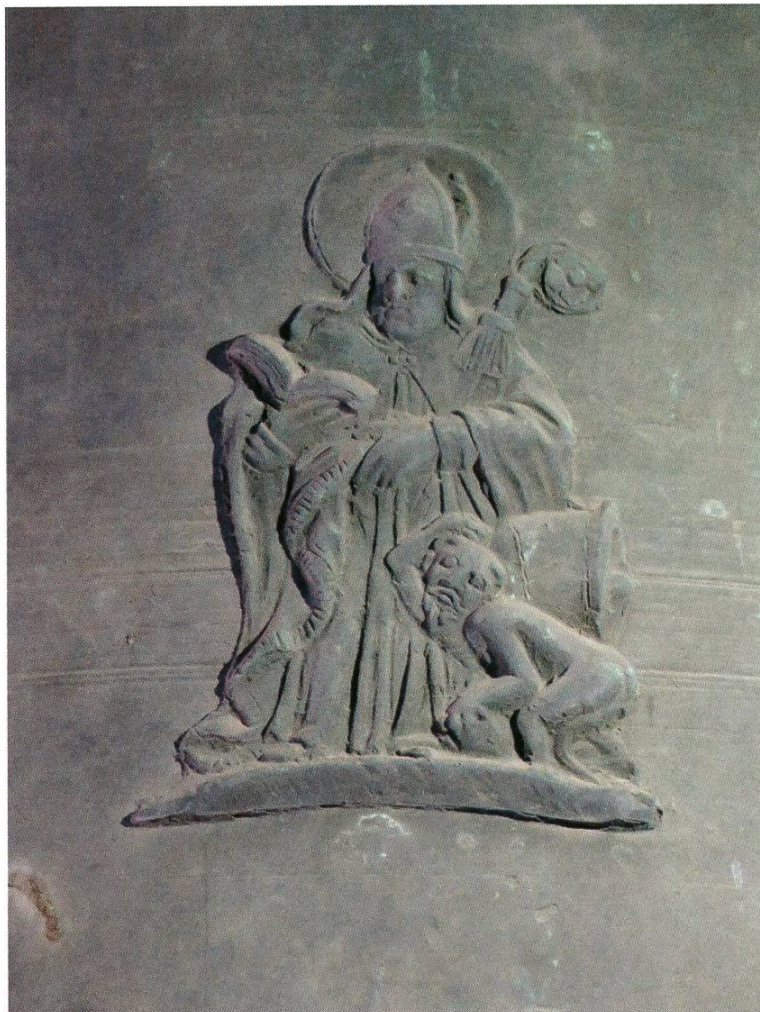
St. Theodul, Detail auf der Betzeit-Glocke

Zu diesen regelmässigen täglichen Glockenzeichen kommen weitere Glockenzeichen mit besonderem lokalgeschichtlichen Hintergrund: