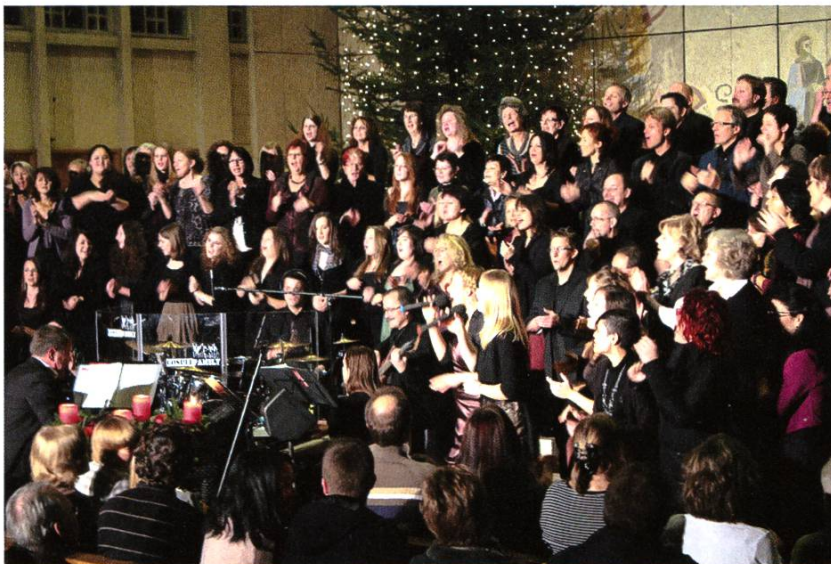
Die «Gospel Family» am Weihnachtskonzert in Rheinfelden.