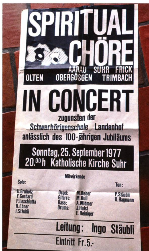
Ein Plakat aus früheren Zeiten.