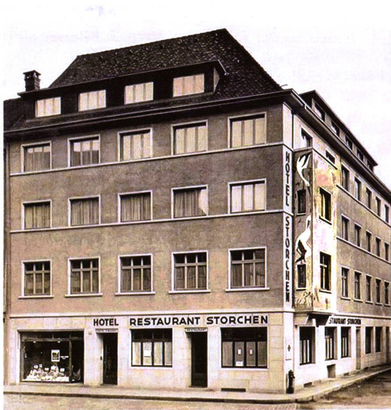
Hotel Solbad Storchen Rheinfelden

Paul erinnert sich an seinen Aufenthalt in Klosters: «Ich kann mich besser daran erinnern, wie wir «Revolver» geschrieben haben, als an die Aufnahme. Ich war in der Schweiz und machte zum ersten Mal Skiurlaub. Ich war bei «Help» ein bisschen Ski gelaufen und hatte Spass daran, deshalb bin ich in die Berge und am Ende hockte ich in einem Schweizer Chalet in einem kleinen Bad und schrieb «For No One».» (Paul McCartney, The Beatles Anthology).