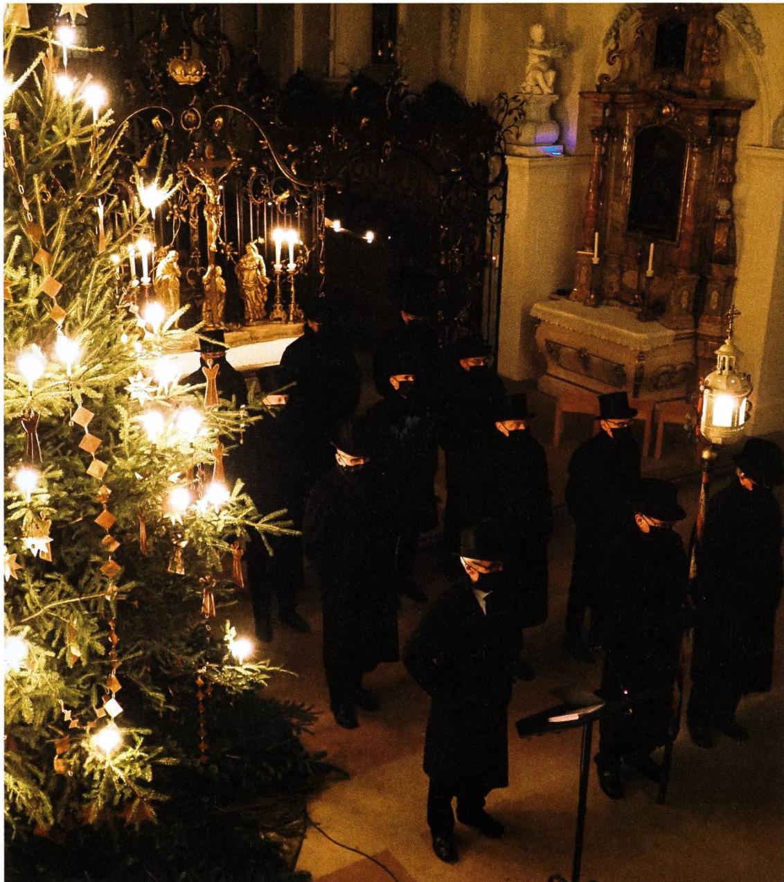
«Christnachtfeier» am 24. Dezember 2020. Die Sebastiani-Brüder stehen stumm in der St. Martinskirche, während ihr Sebastianilied elektronisch abgespielt wird.

Das Brunnensingen musste nämlich in den Jahren 1918 und 2020 ausfallen – und zwar jeweils wegen einer Pandemie – aber diese beiden Male waren es Viren, die diese Pandemien auslösten – und zwar mutierte Vogelgrippe-Viren.