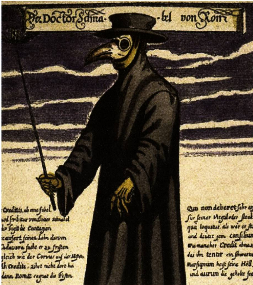
Italienischer Pestdoktor mit der typischen Schnabelmaske.

700 Einwohner (bei einer Einwohnerzahl von ca. 1000). Ob dies stimmt, wissen wir nicht genau – die Zahl scheint etwas übertrieben, meistens verstarb ca. 1/3 der Bewohner einer Stadt, oder eines Dorfes.