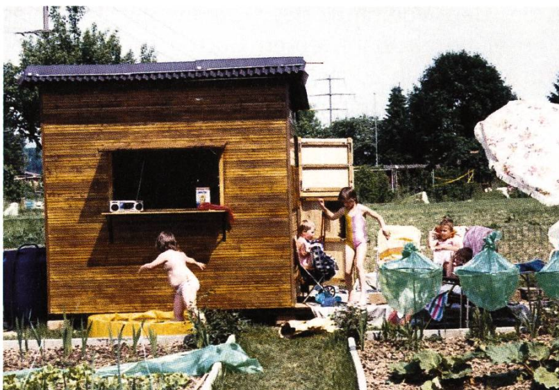
1989, die ersten Gartenhäuschen stehen und die Kinder freuts.