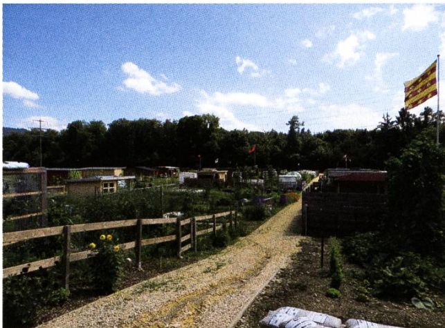
2021, die vorläufig letzte Parzelle Neuland V mit 40 Pflanzplätzen wurde im Jahr 2020 freigegeben.