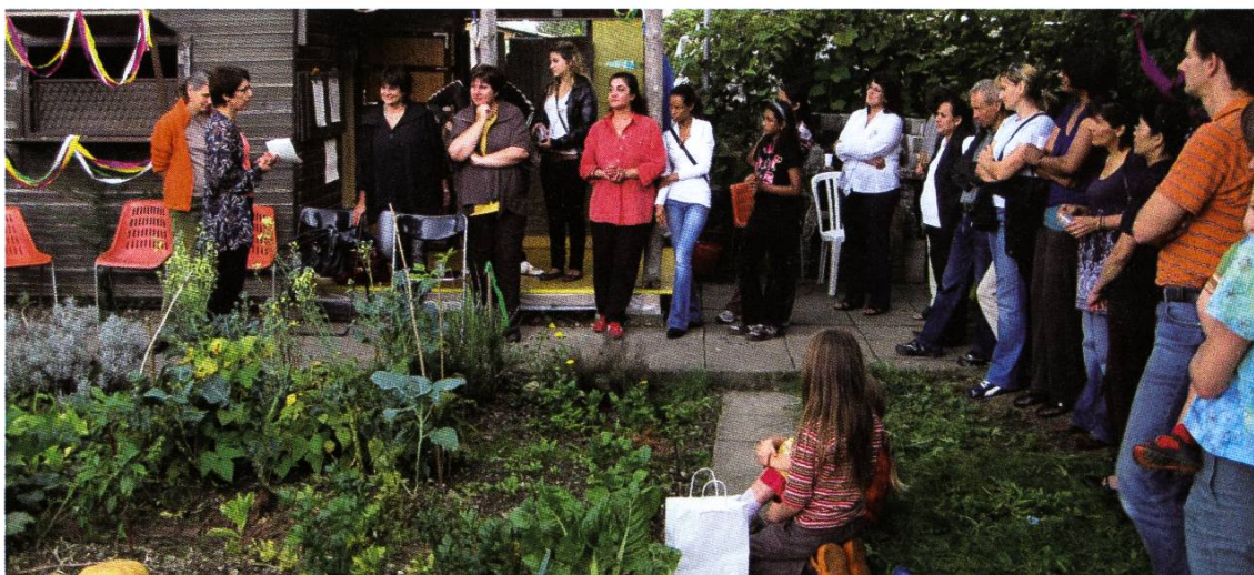
Das Erntedankfest ist ein wichtiger Termin für alle Beteiligten.