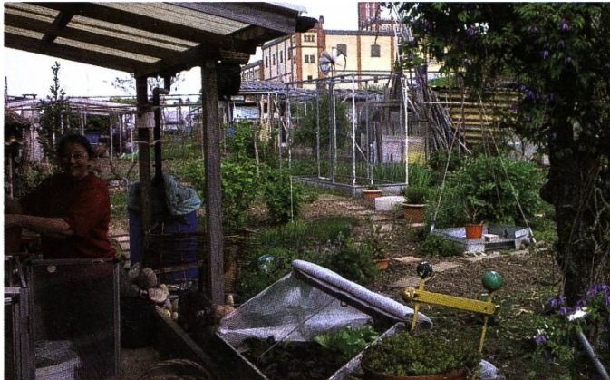
Einer von 27 Pflanzplätzen in der Breitmatt. Aufnahme von 2012.

Familiengartenvereins Breitmatt hat das ganze Drama trotzdem ein halbwegs gutes Ende genommen, haben sie sich doch mittlerweile an ihren neuen Ort im Neuland gewöhnt. Immerhin sind sechs von ihnen bereits pensioniert.