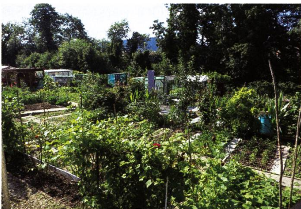
Der Verein für Familiengärten Augarten liegt direkt am Wanderweg zwischen Kaiseraugst und Rheinfelden.