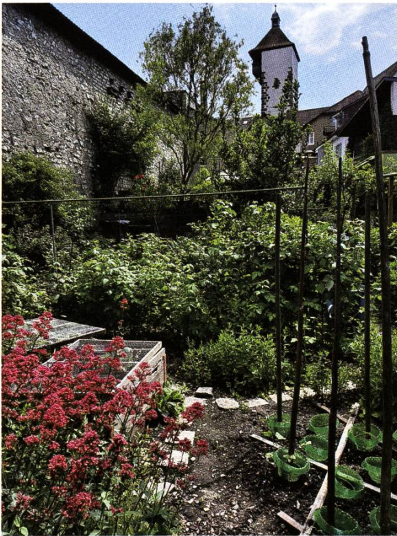
Gartenidylle direkt an der Stadtmauer im Adlergarten.