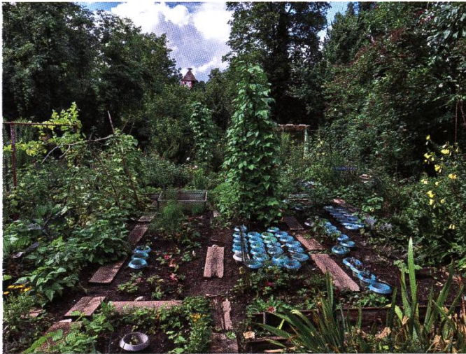
Schrebergarten im Gottesacker mit Blick auf den Storchennestturm.

Ein weitere «Enklave» städtischer Pflanzplätze befand sich direkt neben dem Schlachthausgebäude an der Quellenstrasse (heutiges Areal Q37). Insgesamt 8 Pächtern war es vorbehalten, dieses Stück Land bis auf weiteres zu bewirtschaften. Am 16. Dezember 1993 erhielten die Pächterinnen und Pächter von der Stadt die Bestätigung, dass sie ihre ursprünglichen Pflanzgärten bis zum Verkauf der Liegenschaft durch die Gemeinde respektive bis zum Räumungsbegehren des neuen Eigentümers weiterhin bewirtschaften dürfen. Das Baugesuch für den Abbruch und den Neubau des neuen Gewerbehäuses wurde schliesslich im Jahre 2005 eingereicht.