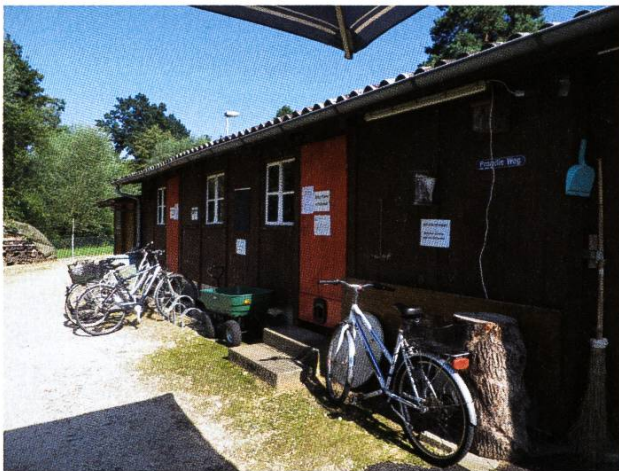
Das Vereinshaus aus dem Jahre 1976, ursprünglich eine Baubaracke vom Bau der Augartensiedlung.