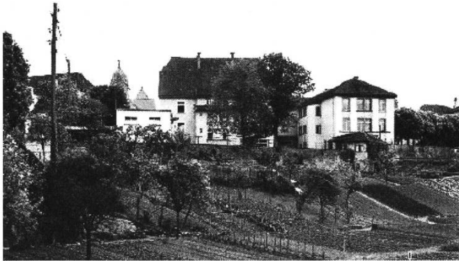
Auch im Schützengraben wurde früher angepflanzt. Aufnahme aus dem Jahr 1953.