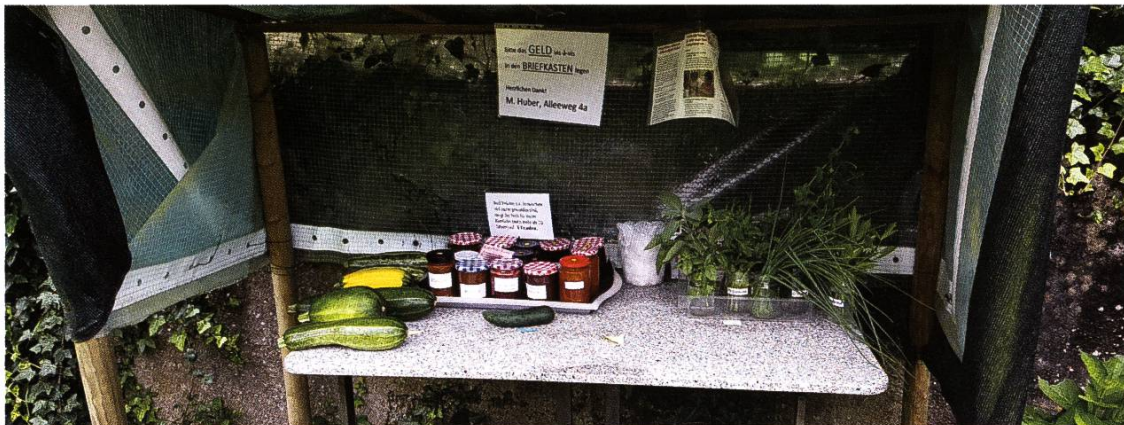
Das beliebte Verkaufstischli am Alleeweg mit Gemüse, Kräutern und sogar Konfitüre.

Heimat im Familiengartenverein Neuland und die restlichen haben ihren Garten aufgegeben. Unmittelbar daneben befanden sich weitere 7 Pflanzplätze, welche nicht dem Familiengartenverein Kohlplatz angegliedert waren. Auch sie mussten diese idyllische Gartenanlage zwecks anderer Nutzung per Ende 2021 aufgeben.