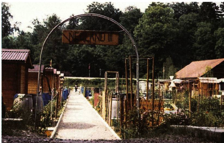
1989, die Parzelle Neuland III wird freigegeben.