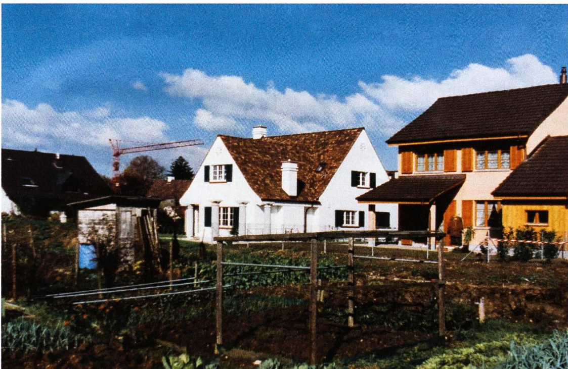
1994/1995 mussten die Pflanzplätze bei der Stampfi den Neubauten am Zeisigweg weichen.