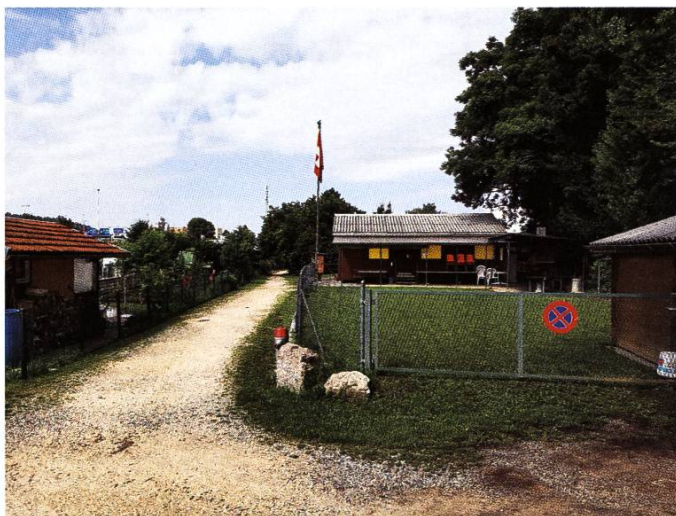
Vereinshaus des Famililengartenvereins Kohlplatz 2021.

verein Kohlplatz integriert wurden auch die beiden Pflanzplätze im Adlergarten, die vier im Gottesacker hinter der katholischen Kirche sowie diejenigen beim Kapuzinerberg. Aktuell kommen die Mitglieder des Vereins aus 11 verschiedenen Ländern. Diese sind wie folgt verteilt: Schweiz 38, Türkei 12, Italien 10, Portugal 4, Kroatien 4, Bosnien 4 sowie je 1 aus Deutschland, Österreich, Ungarn, Rumänien und Libyen.