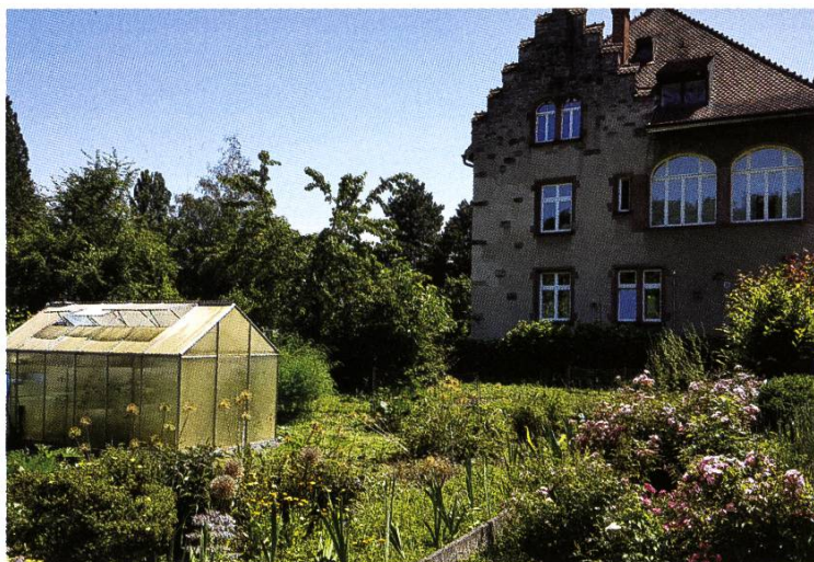
Pflanzplätze am Kapuzinerberg vor der Villa Doser.