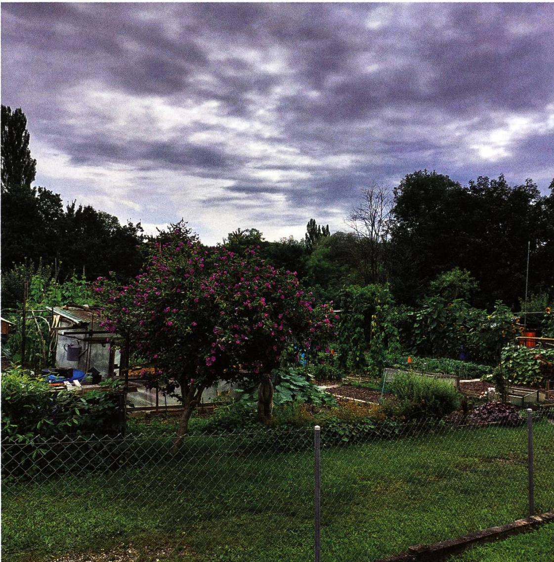
Blick auf die 6 Pflanzplätze am Ende der Magdenerstrasse.