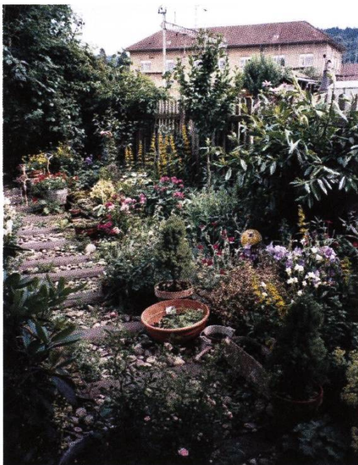
Teilweise direkt auf oder unmittelbar neben einem stillgelegten Bahngleis befanden sich die Pflanzplätze hinter dem ehemaligen Schlachthaus im Hintergrund. Aufnahme aus dem Jahre 2002