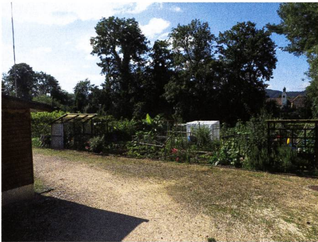
Pflanzplätze im Augarten, im Hintergrund die Kirche von Warmbach.