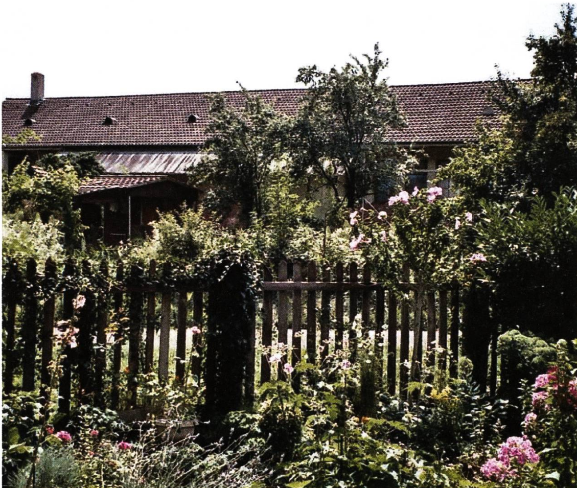
Aufnahme aus dem Jahre 2005 hinter dem ehemaligen Schlachthaus, die Bauprofile im Hintergrund deuten bereits auf das heutige Q37 hin.

Eine rund 30 Aren grosse Parzelle, welche der Brauerei Feldschlösschen gehörte, konnte ebenfalls während Jahren als Schrebergarten genutzt werden. Insgesamt teilten sich 16 Parteien dieses Landstück untereinander auf. Auch einige schöne Gartenhäuschen durften dort erstellt werden. Myrta Buikema erzählt heute noch mit Begeisterung von den drei schönen Jahren in der Stampfi. Beim Buddeln im Garten fand sie sogar Münzen, Tonscherben und eine Spindel, welche sie einem Museum in Liestal übergab. Als dann aber 1994 weitere Einfamilienhäuser gebaut wurden und auch der Zeisigweg entstand, war es um diesen idyllischen Pflanzplatz geschehen. Es ging dann ziemlich rasch, und das Areal musste geräumt werden. Einige von ihnen fanden unmittelbar Anschluss beim Familiengartenverein Neuland.