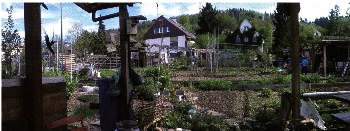
Der Familiengartenverein Breitmatt gehört der Vergangenheit an. Aufnahme von 2012.